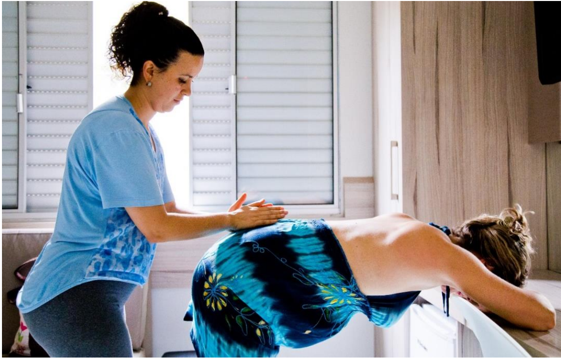
Figura 3 – Atuação da doula no trabalho de parto.