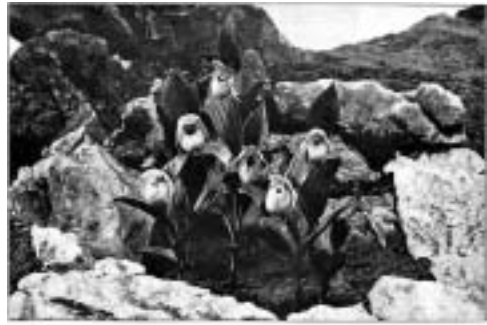
写真5：「ホテイアツモリ」の写真。写真には「日本から到着してから3ヶ月後」と記されている。出典：Reginald Farrer (1907) My Rock Garden . Edward Arnold. London

このファラーのイングルボローの地所での試みはその地域の環境に適したエキゾチックな植物を植えて風景の「改良」をめざした、ハイブリッドな庭園と捉えることができる。(Tachibana et al, 2004)