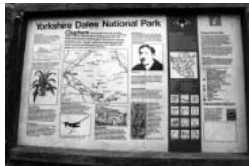
写真6：「ヨークシャーデール国立公園によってたてられた、クラップム村について説明する看板・レジナルド・ファラーの顔のイラストが描かれている」

現在、イングルボロー屋敷の地所は、ヨークシャーデール国立公園の中に含まれている。英国の国立公園 National Park は、多様な野生動物が生息する自然保護区ではなく、その中には、私有地が多く含まれており、農業や放牧が行われている人間の生活空間でもあることに特徴がある。イングルボロー屋敷の地所のあるクラップム村には、ヨークシャーデール国立公園によってたてられた、クラップム村について説明する看板がある。そこには、イングルボローの歴史や地質・動植物の多様な生態の説明と並んで、レジナルド・ファラーの顔のイラストも描かれている。