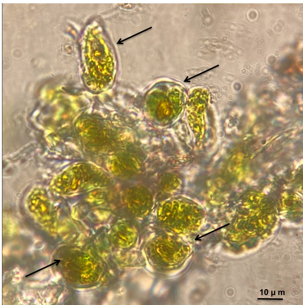
Figura 3: Algas unicelulares (flechas) del género Trentepohlia C. Martius, asociadas a hongos del género Glyphis Ach.