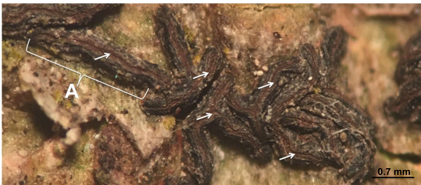
Figura 2: Lirelas (A) de Glyphis substriatula (Nyl.) Staiger, con abundante pruina parda en la abertura de los labios (flechas).