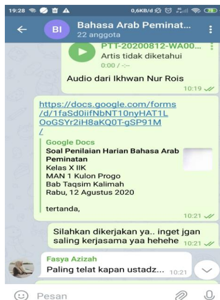
Gambar 4. Evaluasi Materi Taqsim Kalimah

Tahap penutupan ini, guru juga membagikan bentuk evaluasi pembelajaran. Hal ini bertujuan untuk mengetahui tingkat pemahaman materi yang telah diajarkan pada pertemuan tersebut, yang mana bentuk evaluasi ini berupa tugas mandiri yang dikerjakan melalui layanan google form .