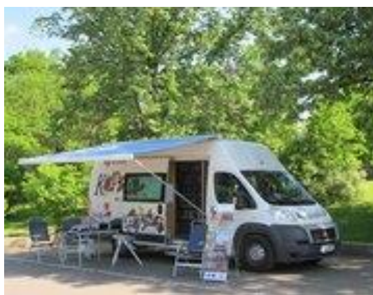
Obrázek 13: Pojízdna knihovna Oskar Městské knihovny v Praze

Historie těchto pojízdných knihoven sahá až do 19. století, a to převážně ve Velké Británii, Spojených státech amerických nebo Finsku. Ve Finsku měly mobilní knihovny v minulém století zásadní vliv, a to zejména z důvodu řídkého osídlení tak velké země, kde byly malé venkovské vesnice i několik desítek kilometrů vzdálené od měst. Proto byly mobilní knihovny nejlepší volbou [Černý, 2010 s. 36]. V této době byly pojízdné knihovny často kočáry tažené koňmi. Na našem území se poprvé pojízdné knihovny objevily až v roce 1939. První pojízdna knihovna v Československu byla zprovozněna v Praze městskou knihovnou, která tento bibliobus dostala darem od Pražské městské pojišťovny. Tato knihovna jezdila pravidelně na 14 stanic v okrajových částech Prahy. Na úkor toho však bylo zrušeno pět malých poboček městské knihovny. V průběhu války byl bibliobus zabaven německou armádou a používán k válečným účelům. K obnovení pojízdných knihoven v Praze došlo v roce 1949, kdy jezdila dvě vozidla na osmnácti stanicích. Na začátku svého provozu bylo každému vozu dáno jiné uživatelské určení. Jeden měl literaturu dětskou a druhý byl pro dospělé čtenáře. Toto rozdělení se ukázalo jako nevyhovující a třetí bibliobus, který byl pořízen v roce 1968, sloužil všem bez rozdílu a nakonec takto začaly fungovat i zbylé dva vozy. Od roku 2009 tvoří pojízdné knihovny samostatné oddělení mobilních služeb, které má zázemí v areálu Hostivařských ateliérů [Pojízdna knihovna, nedatováno].