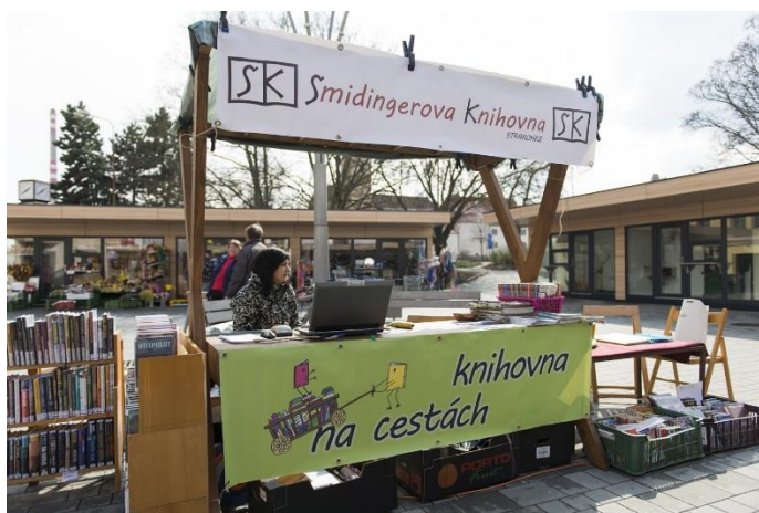
Obrázek 10: Knihovna na cestách ve Strakonících

Knihovna na cestách je projekt Šmidingerovy knihovny ve Strakonících. Ta se rozhodla ke své propagaci využít knihovní stánek (zobrazený na obrázku č.10), který již několikrát představila přímo v ulicích. Stánek byl již umístěn například v Městské tržnici nebo u plaveckého stadionu. Vybrané knihy si na tomto stánku mohli registrovaní čtenáři běžně půjčovat a neregistrovaní čtenáři si mohli knihu vypůjčit za vratnou kauci. Smyslem projektu bylo půjčování knih na netradičních místech a přiblížení knihovny svým čtenářům. Šmidingerova knihovna je velmi aktivní knihovnou a zapojila se do mnoha jiných projektů na podporu čtení. Příkladem jsou Kniha do vlaku nebo MINI knihovna [Šmidingerova knihovna Strakonice, 2014].