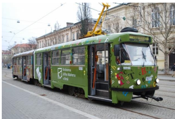
Obrázek 12: Upravená brněnská tramvaj

Knihovna Jiřího Mahena v Brně zapojila do své kampaně na podporu čtení dopravní prostředek, a to konkrétně tramvaj, která je vidět na obrázku č.12. Za podpory Dopravního podniku města Brna byl vytvořen projekt Knihovna v tramvaji – Tramvaj do knihovny. Samotná tramvaj je přetvořena tak, aby upoutala již na první pohled a odlišila se od klasických tramvají v Brně. Nátěr tramvaje je tedy poset letícími písmeny, a především je na něm vyobrazeno 100 titulů, které nejsou náhodné, ale byly vybrány z nejpůjčovanějších knih v brněnské Mahenově knihovně. Vnitřní vybavení a výzdoba tramvaje má za cíl cestující navnadit na čtení a popřípadě na návštěvu samotné knihovny. Součástí vybavení jsou pravidelně aktualizované tipy na knihy, jejich úryvky a také osobní doporučení knihovníků.