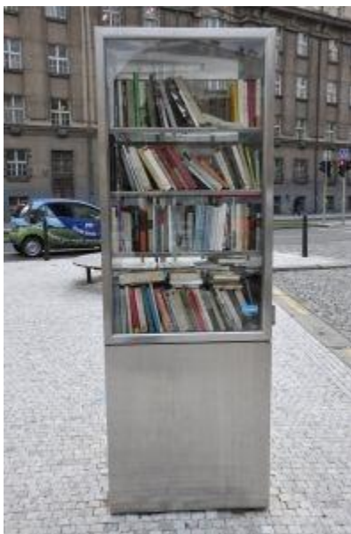
Obrázek 3: Pouliční knihovna na Praze 6

jako nezisková organizace. V té době již bylo rozmístěno více než 400 knihoven po celých Spojených státech. K červnu 2016 je registrovaných více než 40 000 Little Free Library po celém světě. Tyto knihovny jsou dostupné a rozmístěné dle své lokality na mapě, kde jsou všechny zaregistrované pod značkou Little Free Library. Knihovny tohoto projektu se dle mapy nacházejí v mnoha zemích Evropy, například v Nizozemsku, Velké Británii či Itálii, ale také v Africe a Asii 4 [Little Free Library, 2009].