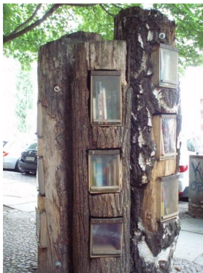
Obrázek 4: Pouliční knihovna v Berlíně

Inspirací pro první pražskou pouliční knihovnu byly pouliční knihovny v Německu. Jednou z nich je originální pouliční knihovna na obrázku č.4, která je koncipována jako kmen stromu. Tato knihovna byla vytvořena v rámci programu Výzkum udržitelnosti lesního hospodářství neziskovou vzdělávací institucí BauFachFrau v roce 2006. Podle původního návrhu měla tato netradiční pouliční knihovna zůstat na svém místě do roku 2008, protože ale dobře plní svoji funkci, tak v berlínské čtvrti funguje dodnes. Samotná knihovna se skládá z několika prolínajících se kmenů, v nichž jsou vyřezány otvory s plastovými dvířky, které chrání obsah před deštěm. V těchto otvorech jsou umístěné knihy, které si návštěvníci mohou půjčovat, nebo naopak poskytovat vlastní knihy [the "Book Forest", 2006].