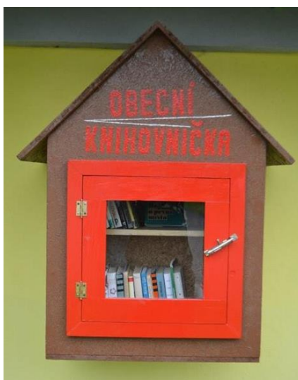
Obrázek 6: Příklad malé pouliční knihovničky

Na obrázku č. 6 je příklad, jak může vypadat malá pouliční knihovnička, která je součástí projektu MINI knihovna. Tato dřevěná knihovnička se nachází v obci Karlov na