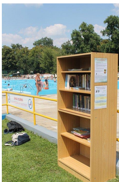
Obrázek 9: Knihovna na koupališti v Kroměříži

V roce 2014 zřídila Městská knihovna v Táboře ve spolupráci s Tělovýchovným zařízením města Tábor svou první mobilní pobočku, kterou provozovala během letních prázdnin u místního venkovního bazénu. Dvakrát týdně zde knihovníci půjčovali pestrou nabídku knih od detektivek, přes čtení pro ženy až k dětským knihám, ale také například deskové hry. Vypůjčené dokumenty mohli registrovaní čtenáři vracet nejenom na koupališti, ale také v klasických kamenných pobočkách knihovny. Zároveň byla pro neregistrované čtenáře dostupná možnost registrace přímo v místě [Služby, 2015].