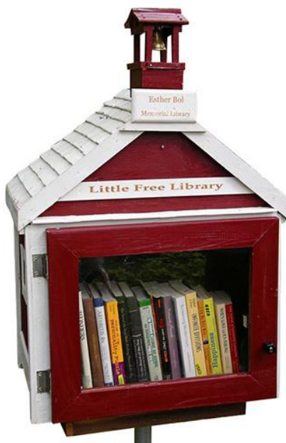
Obrázek 2: První Little Free Library budka, zdroj: https://littlefreelibrary.org/

V současnosti je po celém světě mnoho malých dřevěných domečků, které představují malé knihovničky. Inspirací pro tyto „knihovny“ je projekt Little Free Library, který vznikl ve Wisconsinu ve Spojených státech v roce 2009. Vše začalo jednou malou dřevěnou napodobeninou školní budovy, kterou postavil Todd Bol na zahradě svého domu jako poctu své matce, která byla učitelka a milovnice knih. Tato knihovna je k vidění na obrázku č.2. Po nadšených ohlasech sousedů a známých vyrobil Bol dalších několik knihovních budek a rozmístil je do veřejného prostoru za účelem volné výměny knih. Společně s Rickem Brooksem, který se zabývá marketingem, jsou iniciátory Little Free Library po celé Americe. Každá z těchto knihoven je originální, ale je postavena se stejným cílem.