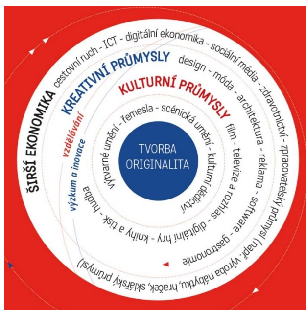
Obrázek 1: Návrh vymezení KKP v České republice, zdroj: http://www.kreativnicesko.cz/

Česká republika převzala jako mnoho jiných evropských států britskou definici KKP. V oblasti KKP se však snaží mapovat své vlastní kulturní a kreativní průmysly. Mapování provádí Institut umění – Divadelní ústav (IDU). Tato instituce poskytuje veřejnosti komplexní služby z oblasti divadla a dalších odvětví umění (hudba, literatura, tanec a vizuální umění). Institut vydává odbornou literaturu, podílí se na mezinárodních projektech a věnuje se vědeckým výzkumům [Institut umění – Divadelní ústav, 2016].