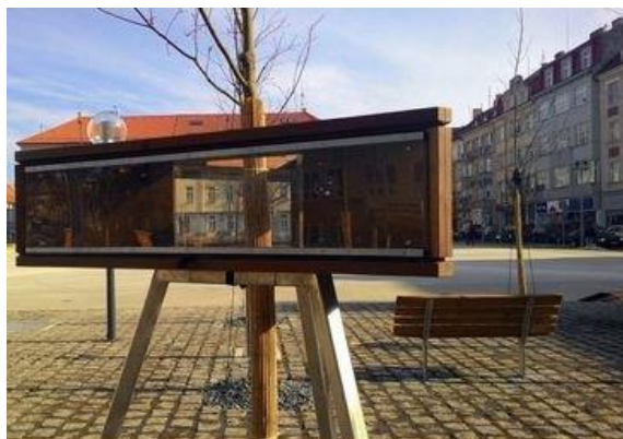
Obrázek 7: Pouliční knihovna v Táboře

Vysočině a je plně funkční již od roku 2014. Zkušenost autorky samotné knihovničky, která je rovněž autorkou této bakalářské práce, ukazuje, že je knihovnička často využívána a dodnes se nesečkala s žádným vandalismem, a naopak je v ní často více knih, než se do ní vejde.