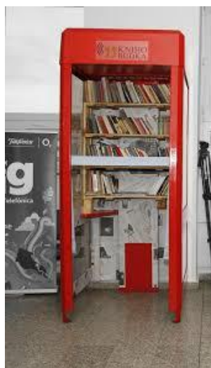
Obrázek 8: První instalovaná Knihobudka v IKEM, zdroj: http://www.knihobudka.cz/

V roce 2013 vznikl neziskový projekt s podporou programu „Think Big“ společnosti Telefónica O2. Prvotním cílem bylo přeměnit sedm nepoužívaných telefonních budek na malé veřejné bezplatné knihovny, které budou umístěny v Praze a okolí. To se také během roku