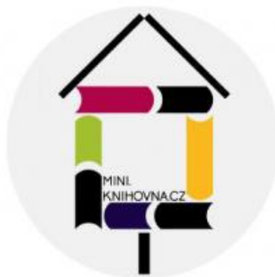
Obrázek 5: Logo projektu MINI knihovna.cz