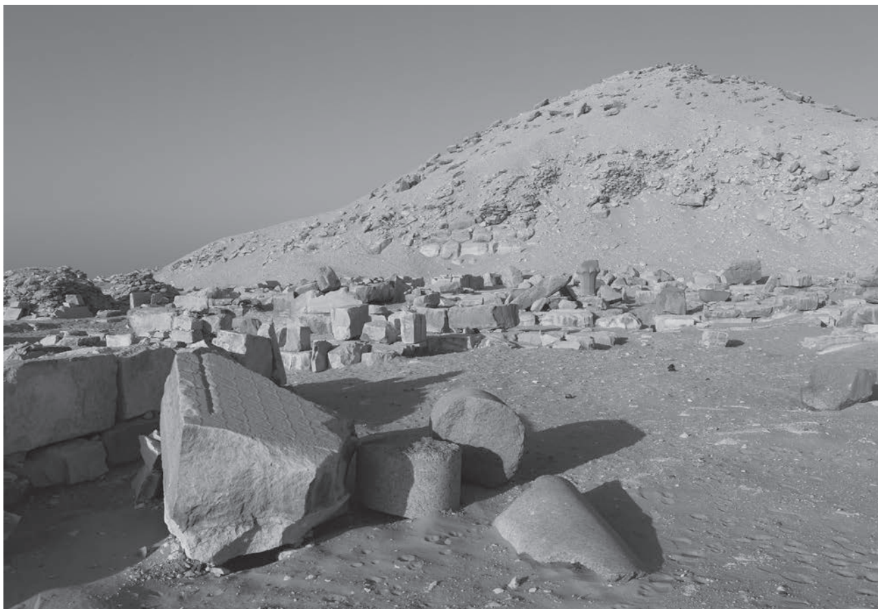
Obr. 1 Pyramidový komplex krále Džedkarea / Fig. 1 Pyramid complex of King Djedkare

Dlouholetý výzkum Českého egyptologického ústavu Filozofické fakulty Univerzity Karlovy (dále jen ČEgÚ FF UK) v Abúsíru přinesl a stále přináší významné poznatky o dějinách 5. dynastie, královské rodině, pyramidových komplexech i hrobkách hodnostářů, ale rovněž o změnách, kterým tehdejší společnost čelila. Přestože abúsírské pohřebiště stále ještě vydává mnoho dokladů, odráží pouze část vývoje – královská rodina je totiž užívala jen po omezenou dobu. Najdeme zde pyramidu panovníků Sahurea, Neferirkarea, Raneferefa a Niuserreha z první poloviny 5. dynastie a rovněž hrobky členů jejich rodiny a nejvyšších státních úředníků (viz např. Verner 2017a a 2017b). Poslední panovníci 5. dynastie, Menkauhor, Džedkare a Venis, se však nechali pohřbít o několik kilometrů jižněji v Sakkáře, a doklady z jejich doby tedy v Abúsíru – až na několik výjimek – nenajdeme.