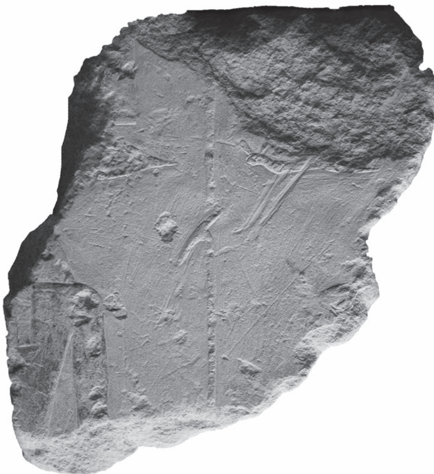
Obr. 6 Zlomek vyobrazení boha Usira z Džedkareova pyramidového komplexu / Fig. 6 Fragment of a depiction of the god Osiris from Djedkare's pyramid complex

Průzkum okolí jižního masivu v roce 2014 a 2017 odhalil, že k němu vedla hojně používaná chodba. Směřovala od západního konce vzestupné cesty k platformě přístupné vchodem opatřeným těžkými dřevěnými dveřmi, jež zanechaly zřetelné stopy na vápencové podlaze (Megahed – Jánosi 2017: 239–241). Pasáž umožňovala přístup k samostatně stojící stavbě umístěné mezi jižní částí zádušního chrámu a vnější obvodovou zdí komplexu (Megahed – Jánosi – Vymazalová 2018: 36–40). Tato budova obsahovala pět dlouhých úzkých místností, je však dnes zničena natolik, že její přesnou