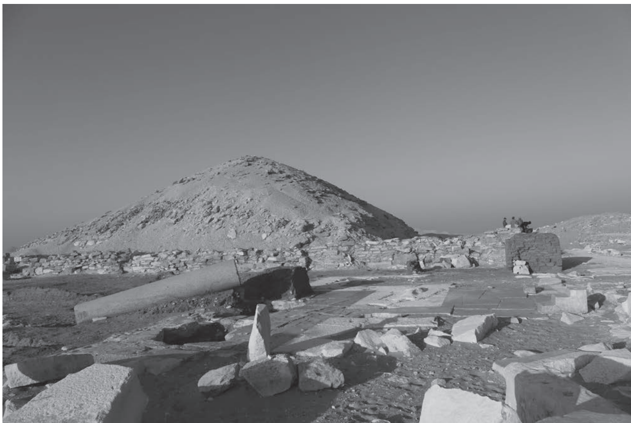
Obr. 8 Portik se sloupem z červené žuly nesoucím jméno Džedkareovy manželky / Fig. 8 Portico with a red granite column, bearing the name of Djedkare's wife

Výzkum v roce 2018 přinesl o osobě Džedkareovy královny zcela zásadní doklady. Na dvou vápencových fragmentech reliéfní výzdoby z jižní části jejího okrsku se totiž podařilo identifikovat její jméno a titul. O několik měsíců později byl nalezen také jeden ze dvou sloupů, jež kdysi podpíraly strop vstupu do jejího komplexu (obr. 8), a nese neporušený nápis „ta, jež vidí Hora a Sutecha, velká žezla hetes , velká přízní, královská manželka, jeho milovaná Setibhor“. Tento nápis na sloupu