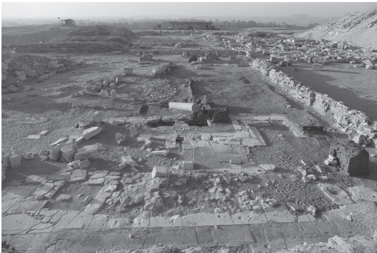
Obr. 7 Pohled na severní část Džedkareova pyramidového komplexu prozkoumanou v roce 2018 / Fig. 7 View of the northern part of Djedkare's pyramid complex, explored in 2018

podobu nelze zrekonstruovat a její funkce nám zůstává neznámá. Z ostatních pyramidových komplexů Staré říše není znám žádný podobný doklad (Megahed – Jánosi – Vymazalová 2018: 39).