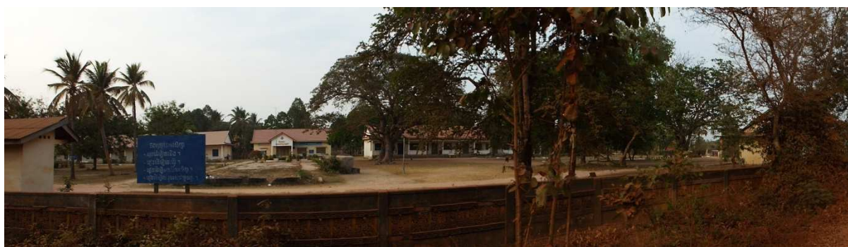
Obrázek 2: Úplná dostavěná škola v provincii Takeo

platům, nižšímu životnímu standardu a malé možnosti kariérního růstu. Ve venkovských školách jsou také méně dostupné kvalitní učební pomůcky, knihy a učebnice ve srovnání s těmi městskými, které již takový problém většinou nemají. Ale právě děti ve vzdálených venkovských oblastech potřebují kvalitní výuku nejvíce, protože jsou zranitelnější než děti z městských oblastí (Arnold, 2015, s. 49). Na obrázku 2 je úplná základní škola, nacházející se v areálu několika budov, který je ohraničený a označený. Úplnou školou se myslí škola, která má minimálně všech 6 tříd základní školy, budovy a třídy plně dostavěné a vybavené a má k dispozici sociální zařízení (Ogisu a Williams, 2015).