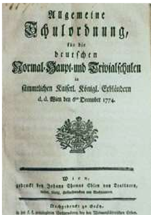
Obrázek 1 Všeobecný školní řád - titulní strana

V roce 1774 vydala Marie Terezie Všeobecný školní řád, ve kterém apelovala na rodiče, aby posílali své děti ve věku 6 – 12 let do školy. V tomto roce se uvádí, že začala povinná školní docházka. Ovšem fakticky tomu tak není, protože spíše jde o to, že školy se otevřely všem, bez ohledu na původ. Ale dá se říci, že povinná školní docházka trvala 6 let.