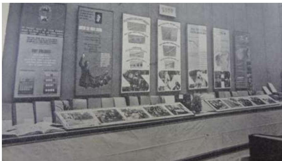
Obrázek 6: Ruské oddělení na výstavě (ZEMAN, 1935, s. 13).

O úspěchu výstavy psalo mnoho českých ale i zahraničních novin a časopisů: „Rudé právo“, „Lidové noviny“, „České slovo“, „Národní politika“, „Prager Presse“, „jugoslávská Stampa“, „Heroldo de esperanto v Kolíně“ atd. Výstava byla doporučena k návštěvě celé řadě škol, které tuto možnost uvítaly a hojně se jí účastnily (Zeman, 1935).