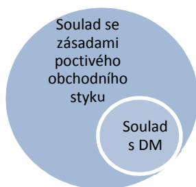
Obrázek 1 - Soulad s dobrými mravy implikující soulad se zásadami poctivého obchodního styku (zdroj: autor diplomové práce)

Tento přístup však odmítl Nejvyšší soud České republiky ve svém rozsudku ze dne 1. července 2008, sp. zn. 29 Odo 1027/2006, kde uzavřel: „ Je nicméně nesprávné, je-li jednání, které je „v rozporu s poctivým obchodním stykem“, a jednání, které „se přičí dobrým mravům“, pojímáno jako vztah příčiny (jednání je v rozporu se zásadami poctivého obchodního styku) a následku (a tudíž se takové jednání přičí dobrým mravům). Kdyby měl být vztah obou ustanovení chápán tímto způsobem, pak by ustanovení § 265 obch. zák. nebylo samostatně aplikovatelné, což odporuje jeho ustálenému výkladu i tomu, jak tento institut interpretuje právní teorie. Jinak řečeno, z toho, že určité jednání je ve smyslu ustanovení § 265 obch. zák. v rozporu se zásadami poctivého obchodního styku, bez dalšího neplyne, že jde o jednání (právní úkon) neplatné, neboť se v intencích § 39 obč. zák. přičí dobrým mravům.“