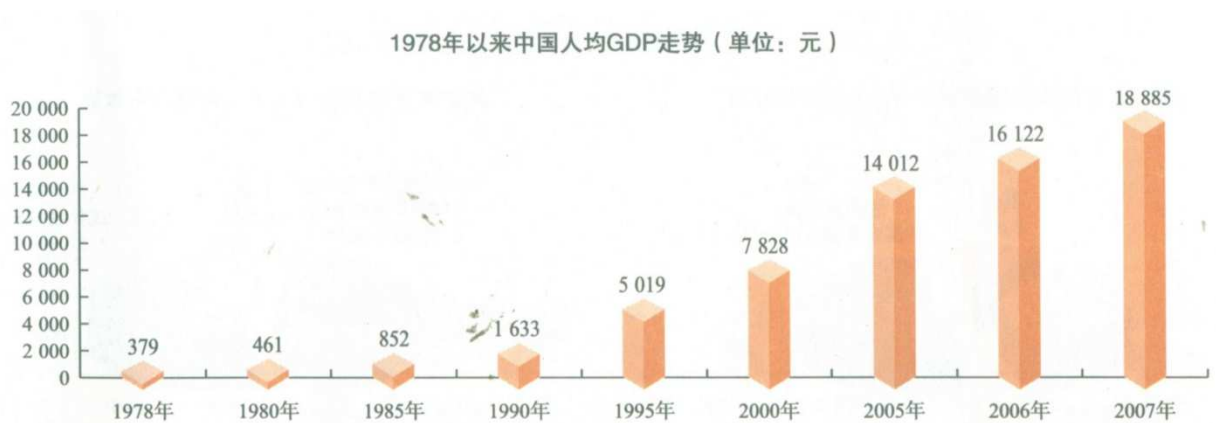
Graf 3. 100 Nárůst HDP na hlavu mezi léty 1978 a 2007 v renminbi . Nárůst značí vyšší produktivitu práce.

Ačkoli absolutní produktivita práce v ČLR zůstávala z pohledu vyspělých zemích velmi nízká, spolu s celkovou produkcí však rostla závratným tempem, které významně přesahovalo většinu zemí světa. Stejně tak pozorujeme nárůst podílu průmyslu na celkovém výstupu, který v tomto období započal a vytvořil tak životaschopný základ pro úspěšnou industrializaci. Celkově tedy reformy podniků přes všechny jejich nedostatky můžeme hodnotit jako úspěšné.