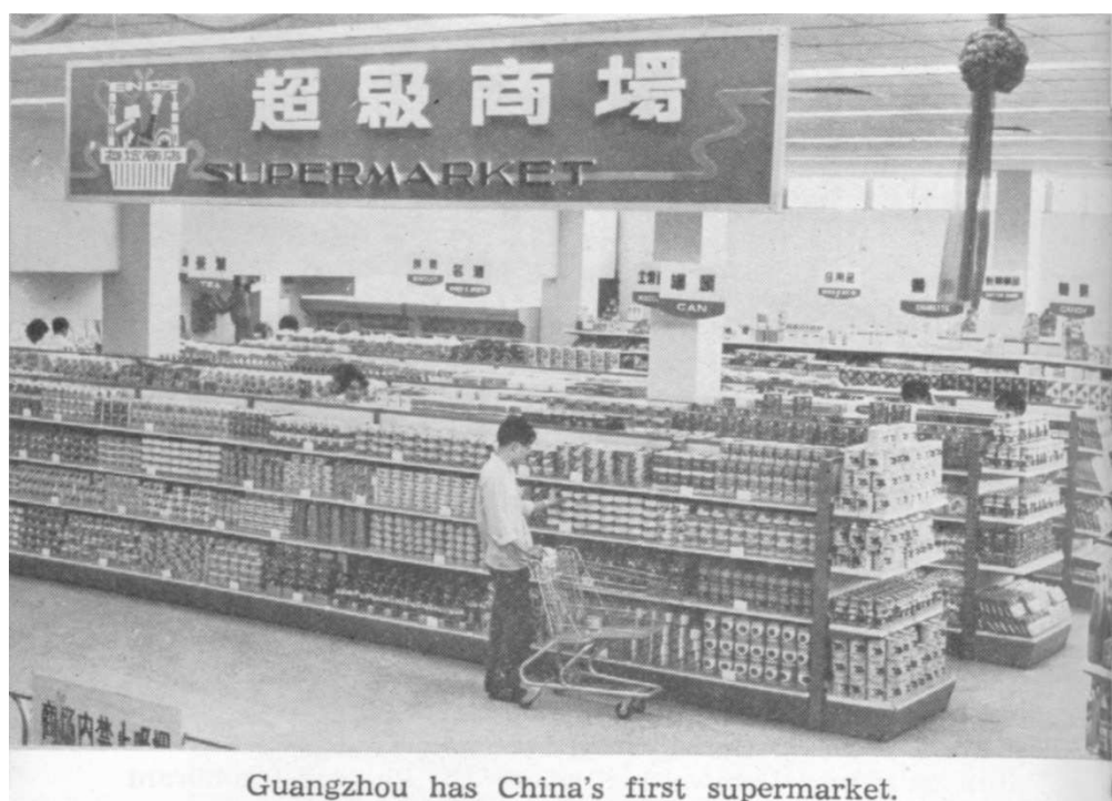
Obrázek 1. 104 První čínský supermarket – známka uvolňování trhů

Trh s výrobními faktory zůstával však nadále velmi omezený. Podniky v podstatě nemohly koupit půdu. Poptávka po půdě výrazně převyšovala její nabídku a převedení vlastnických práv půdy na podnik předcházela dlouhá vyjednávání s lokálními úřady. Kompenzace byla běžně nefinančního rázu, typické bylo výměnou za půdu přislíbit určitý počet pracovních míst v podniku. Na podobná omezení podniky narážely na trhu práce. V 80. letech bylo především pro státní podniky velmi obtížné přijímat a propouštět zaměstnance včetně sezónních zaměstnanců. 103