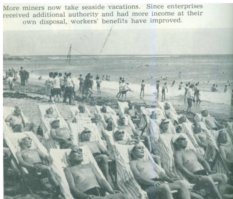
Obrázek 2. 113 Mezi firemní benefity patřily i organizované dovolené pro zaměstnance

V předreformním období bylo v ČLR běžné celoživotní zaměstnání. Nebyla v něm za normálních okolností možná žádná mobilita, ať už horizontální či vertikální. Volba zaměstnání nebyla svobodná, po dokončení školy byl dělník jednoduše přidělen určité výrobní jednotce. Zároveň dělníci nemohli být propuštěni, a to bez ohledu na jejich pracovní výkony a odměny nijak nekorelovaly s efektivitou zaměstnanců, ale byly tabulkové.