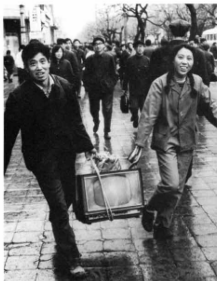
A young Peking couple delighted at having acquired one of the "eight big": television, refrigerator, stereo, camera, motorcycle, furniture set, washing machine, and electric fan

Výsledky na poli vzdělávání a zdravotnictví byly výrazně slabší. Zatímco roku 1975 nastoupilo na nižší střední školu 91% dětí a na vyšší střední školu 60%, roku 1982 to bylo pouze 66%, respektive 32%. 117 Od roku 1982 se tento trend zlepšoval, v 80. letech však nedosáhl úrovně Kulturní revoluce. Míra negramotnosti a pologramotnosti klesala, avšak je pravděpodobné, že se jednalo o demografický vliv, nikoli o vliv reforem.