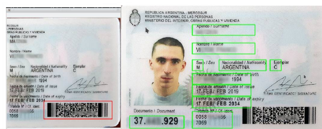
Figura 3. Identificación de campos y extracción de información.