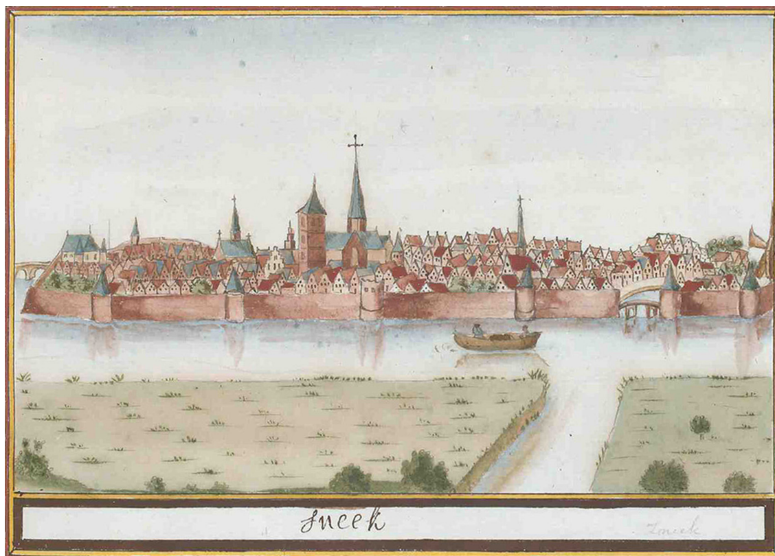
Sneek in de Atlas van Schoemake

dan echte kloosterlingen ook bezit mochten hebben en inkomsten genieten. In de praktijk volgden deze conventen echter wel een kloostermodel. De zusters beloofden gehoorzaam te zijn aan een overste en storten hun geld in de gemeenschappelijke kas. Het enige dat hen onderscheidde van de oudere instellingen was dat ze veel tijd kwijt waren met het bedrijven van handwerk, met spinnen, weven, boter en kaas maken en dergelijke, om zelf de kost te verdienen. De consequentie daarvan was dat ze geen uitgebreide koordiensten in het Latijn konden zingen maar het moesten doen met korte en eenvoudige officies in de volkstaal. Hun talrijke inwoners, door de omgeving aangeduid als bagijnen of begijnen , beschouwden zichzelf echter wel degelijk als kloosterlingen. En hun bescheiden nederzettingen, die voor het merendeel in of dichtbij steden tot stand kwamen, werden ook door de buitenwacht kloosters genoemd. Zo ook in het geval van Sinte Elysbeths cloester opten berch Olyveten by Sneek .