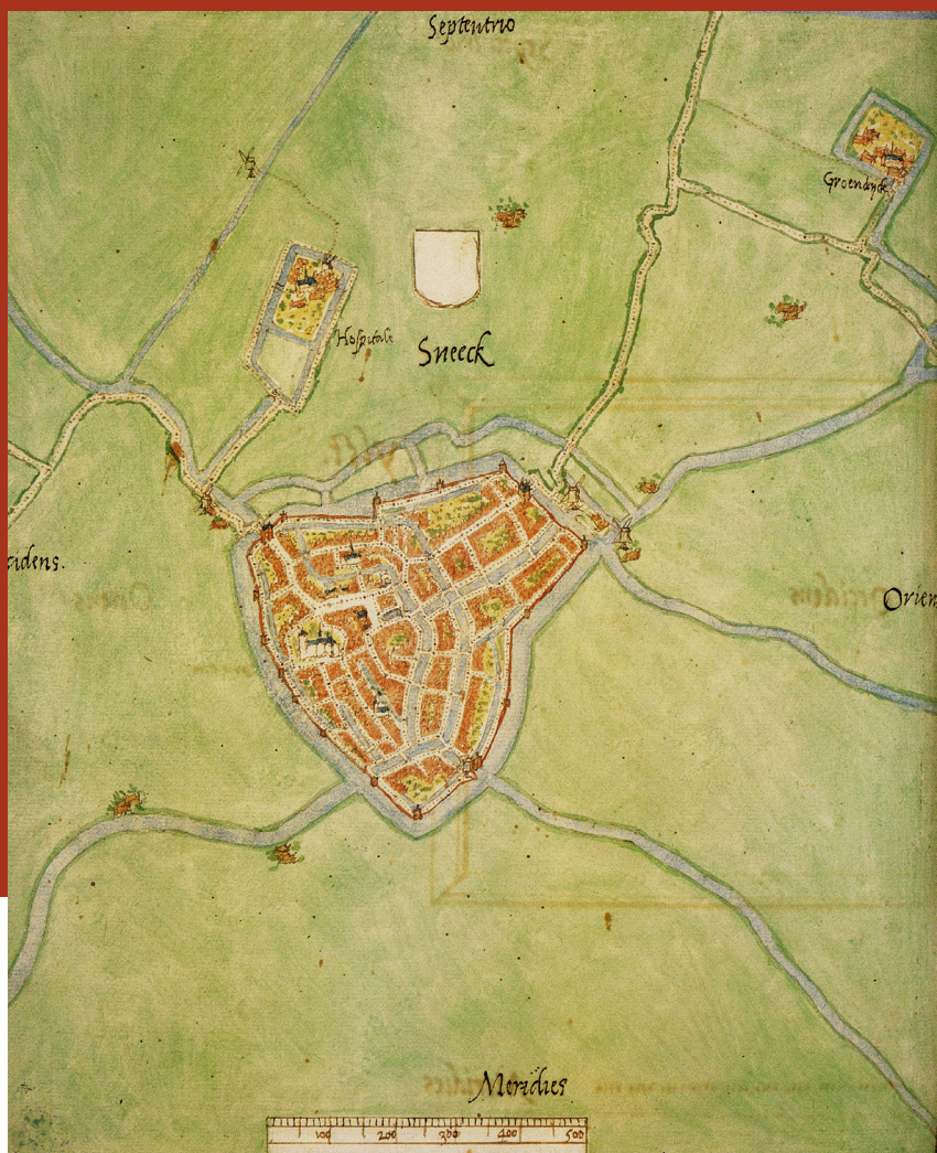
Klooster Groendijk (rechtsboven) op de kaart van Van Deventer (ca. 1560).

Bij dat alles hadden de partijen eveneens elkaars pachters lastig gevallen en schade berokkend. In de zoenbrief nu werd alle schade, doodslag en letsel van beide partijen tegenover elkaar geplaatst en getaxeerd, waarbij het nodige tegen elkaar werd weggestrept, maar van de