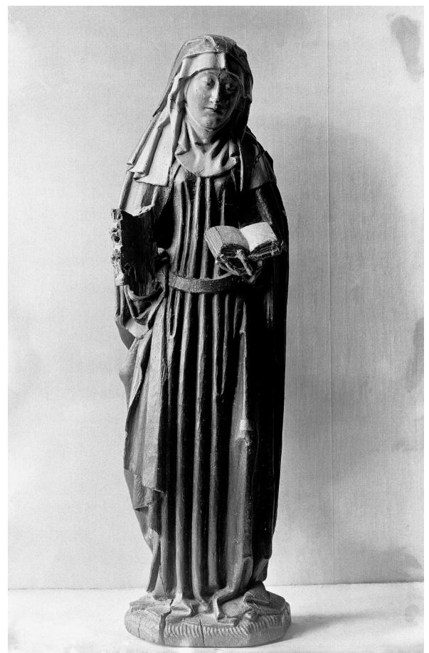
De heilige Elisabeth. Sculptuur van eikenhout door de Meester van Koudewater (navolger van), ca. 1480 - ca. 1490. Coll. Rijksmuseum

Het vernieuwde klooster kreeg de naam Bethanië toegewezen. Omdat uit de Sneker recesboeken bekend is dat de Sneker kruisheren in 1507 gevestigd waren in het 'olde hospitaal', 5 terwijl zij daar sinds 1464 zelf geen sociale zorg bedreven, kan aangenomen worden dat de tertianen eerder als ziekenzorgers bij dat hospitaal of gasthuiscomplex werkzaam waren geweest. Dat complex was dan naar alle waarschijnlijkheid gelieerd aan de Sint Antoniuskerk, die toch al zeker in de late veertiende eeuw in Sneek bestond. Denkbaar is nu dat