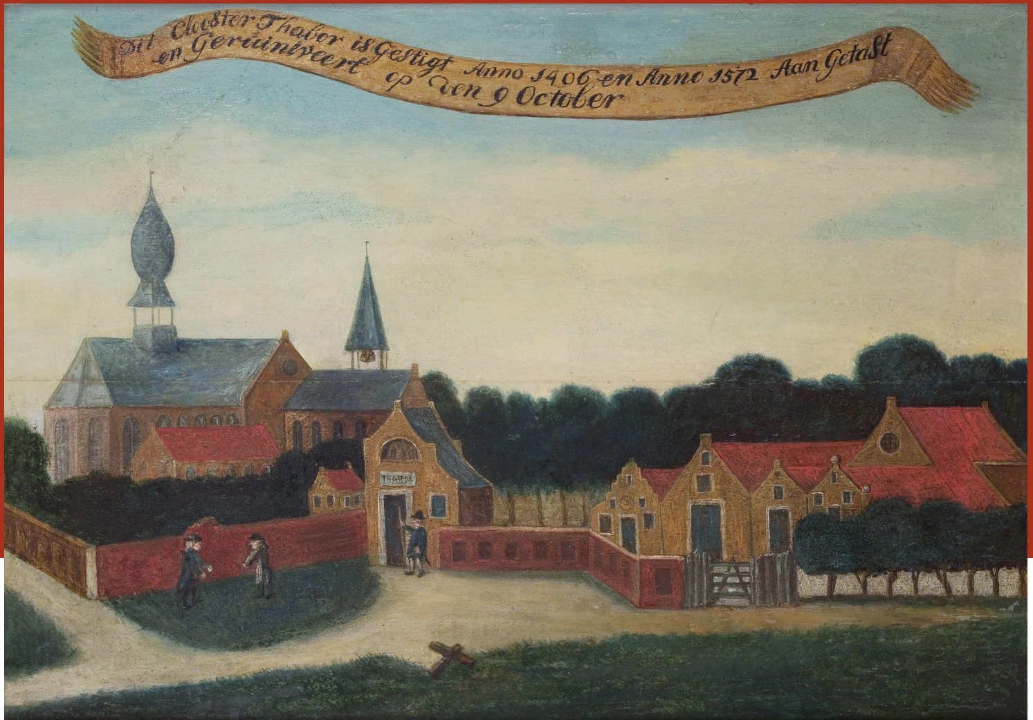
Het klooster Thabor