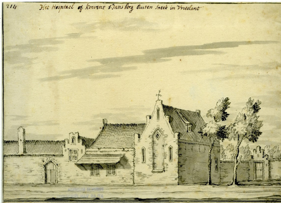
Het Hospitaalklooster op een tekening van Stellingwerf (1722)

er sprake is geweest van een dubbelconvent, met zowel lekenbroeders als lekenzusters.