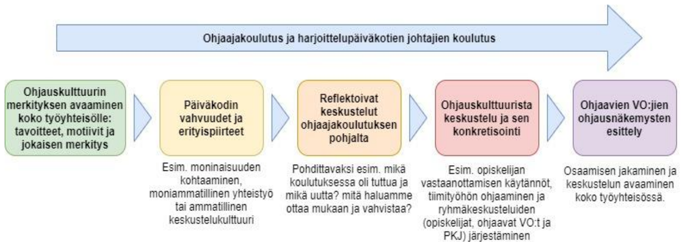
Kuvio 3. Ohjauskulttuurin kehittämisen askeleet harjoittelupäiväkodissa

Seuraavassa kuviossa esitämme yhden mallin ohjauskulttuurin kehittämisen askeleiksi. Malli pohjautuu harjoittelupäiväkodin johtajan laatimaan kuvaukseen työskentelyn etenemisestä. Ohjauskulttuurin kehittäminen ja ylläpitäminen ovat kuitenkin jatkuva prosessi, joka vaatii säännöllistä työstämistä ja keskustelua.