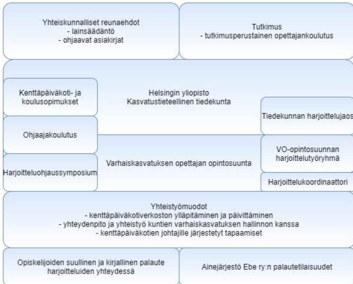
Kuvio 4. Varhaiskasvatuksen opettajankoulutuksen harjoittelu organisointi Helsingin yliopistossa

Yliopisto määrittelee ja säätelee opettajankoulutukseen kuuluvaa harjoittelua ja siihen liittyvää ohjausprosessia. Harjoittelujen toteuttamisen tueksi on luotu rakenteita, jotka edistävät opetussuunnitelmaan kirjattujen harjoittelun tavoitteiden toteutumista. Näitä rakenteita on kuvattu Helsingin yliopiston osalta kuviossa 4.