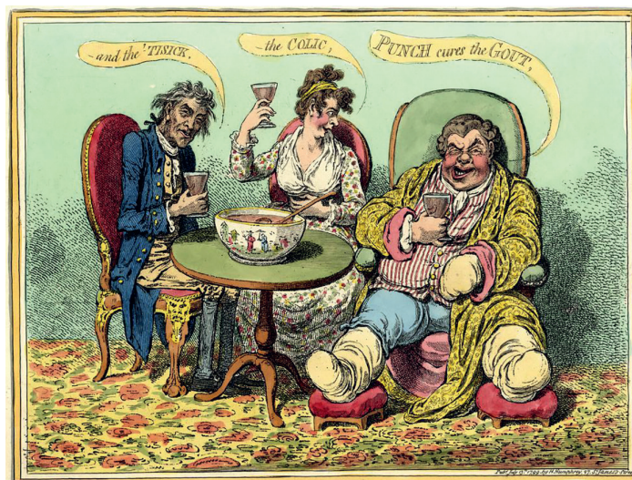
4. ábra. Az arisztokrácia „örökletes betegségeinek” karikatúrája.

Blumenbach elmélete kiválóan illeszkedett a tudomány és orvoslás dinamikusan fejlődő gondolatai közé és megtestesítette a fizioológiai alapú funkcionális identitást, amit a filozófusok és a társadalmi folyamatokkal foglalkozó elméleti szakemberek aspirációnak neveztek. A Bildungsrieb tehát gyorsan utat talált a német természetfilozófusok (Naturphilosophie) körében és a filozófiai gondolkodás központi témájává vált. A Naturphilosophie a természet egységét és összekapcsolódásának lehetőségeit vizsgálta (3. ábra). Ebben a felfogásban a természet objektív összessége és az intelligencia, mint minden öntudatossgot megalkotó tevékenység rendszere egyformán