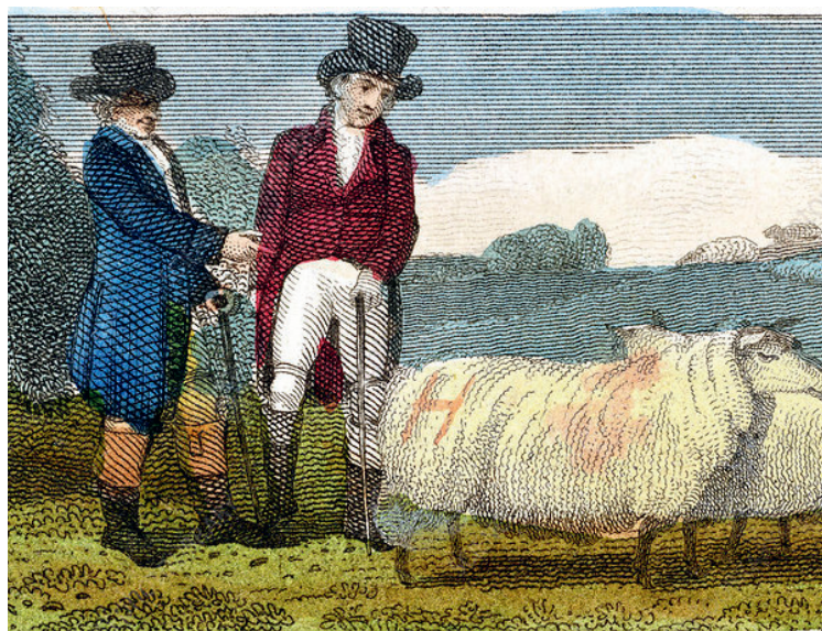
5. ábra. Állattenyésztő gazdák tanácskoznak Robert Bakewell, Dishley (New Leicester) birkájának jellegzetes hordó formájával kapcsolatban. (Forrás: Ismeretlen szerző metszete, 1822)

Az orvoslás területén a XIX. század elejére Európa a leszarmazás, genealógia megszállottjává vált. Az 1820-as évekre az európai és nem európai egyének (rasszok) házasságából származó fiúkat és lányokat a tudósok általában hibrideknek nevezték, és olyan lényként tekintettek rájuk, amelyek fenyegetik a fehér és nem fehér emberiség közötti határvonalat [9]. Az illegitimitással kapcsolatos jól megalapozott keresztény erkölcsi diskurzusból kiindulva többnyire a szegény előjelének tekintették őket, melyek ambivalens módon megkérdőjelezték a különböző kultúrák iránti hűséget és fenyegetést jelentettek az uralkodó rend számára. Erre alapozva a XIX. századi francia orvosok például különleges tanácsokat adtak a nemesi családok számára, hogy elkerüljék a generációkon átívelő betegségek terjedését. Ez volt a francia hérérdité, amely a latin haereditari morbi (örökletes be-