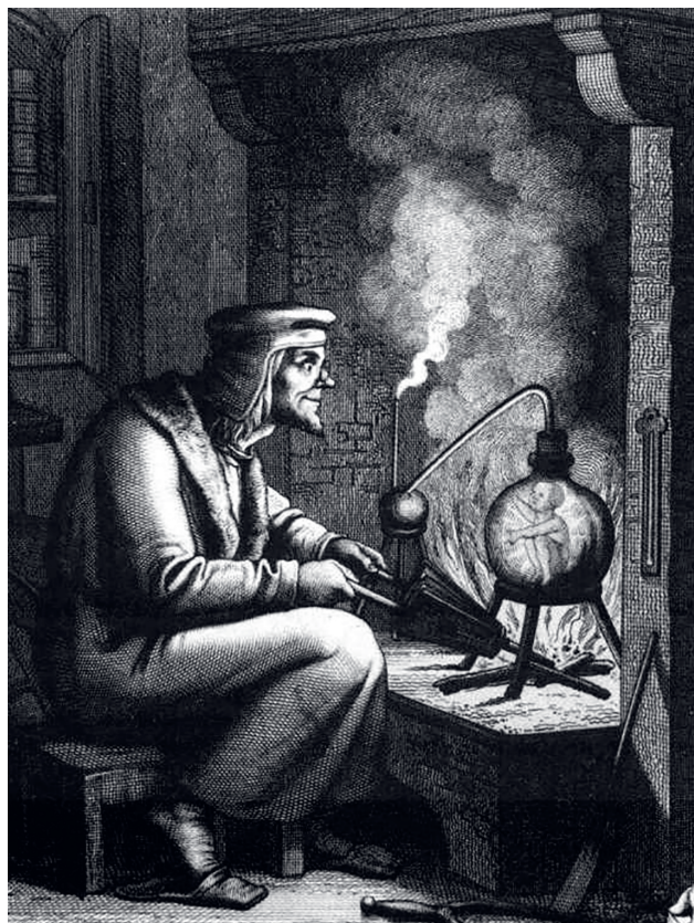
1. ábra. Az alkímisták az emberi élet teremtő szubsztanciája után is kutattak. Úgy vélték, hogy a homunculus – a kisméretű, emberszerű lény a lombikban – vegyi úton előállítható. Ezt az elképzelést később összekapcsolták az öröklődéssel és úgy vélték, hogy az ivarsejtekben egy preformált homunculus található. (Forrás: XIX. századi metszet Goethe Faustjából (2. rész); Az alkímista és a homunculus)

Az a perspektíva, mely az öröklődés biológiai fogalmának megalkotásához vezetett, sem szokványos eszmétörténeti, sem pedig pusztán (társadalom)történeti folyamatokkal nem magyarázható. Az alábbiakban szeretnék rávilágítani az öröklődésről alkotott gondolatokra, koncepciókra, melyek összekapcsolódásából létrejött az öröklődés, mint biológiai fogalom. Ebben Festetics Imre (1764–1847) megfigyeléseinek fontos szerep jut és gondolatai illeszkednek az öröklődésről alkotott XIX. századi elképzelések közé, de azon jóval túlmutatnak, bár ennek 1822 utáni vizsgálatában jelenlegi tudásunk szerint Festetics Imre már nem vett részt.