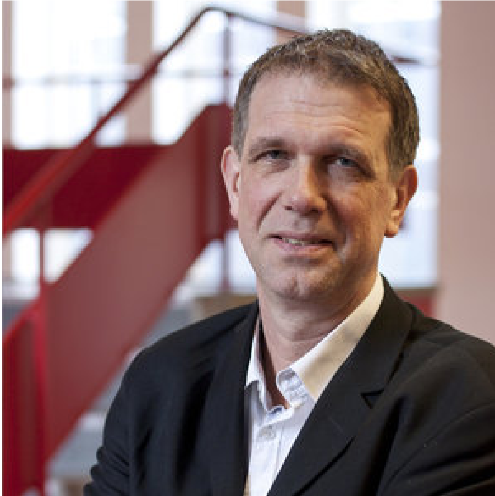
Figuur 1 Hoogleraar Housing Systems Peter Boelhouwer