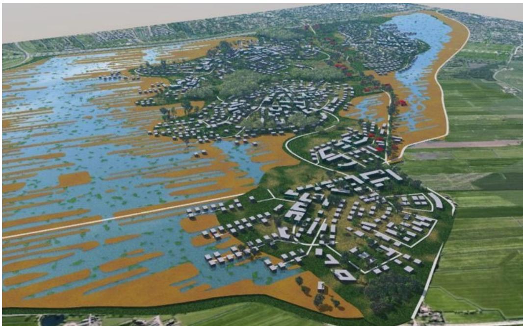
Figuur 3. Gebiedsvisie Rijnenburg door de gemeente Utrecht uit 2008 door VISTA landschapsarchitectuur en stedenbouw. Het nieuwe college in Utrecht wil de uitleglocatie benutten voor windmolen.

Gezinswoningen zijn daar niet zo geschikt voor omdat daar juist veel vraag naar is. Appartementen, leegstaande gebouwen/kantoren en grote vrijstaande woningen lenen zich daar meer voor.