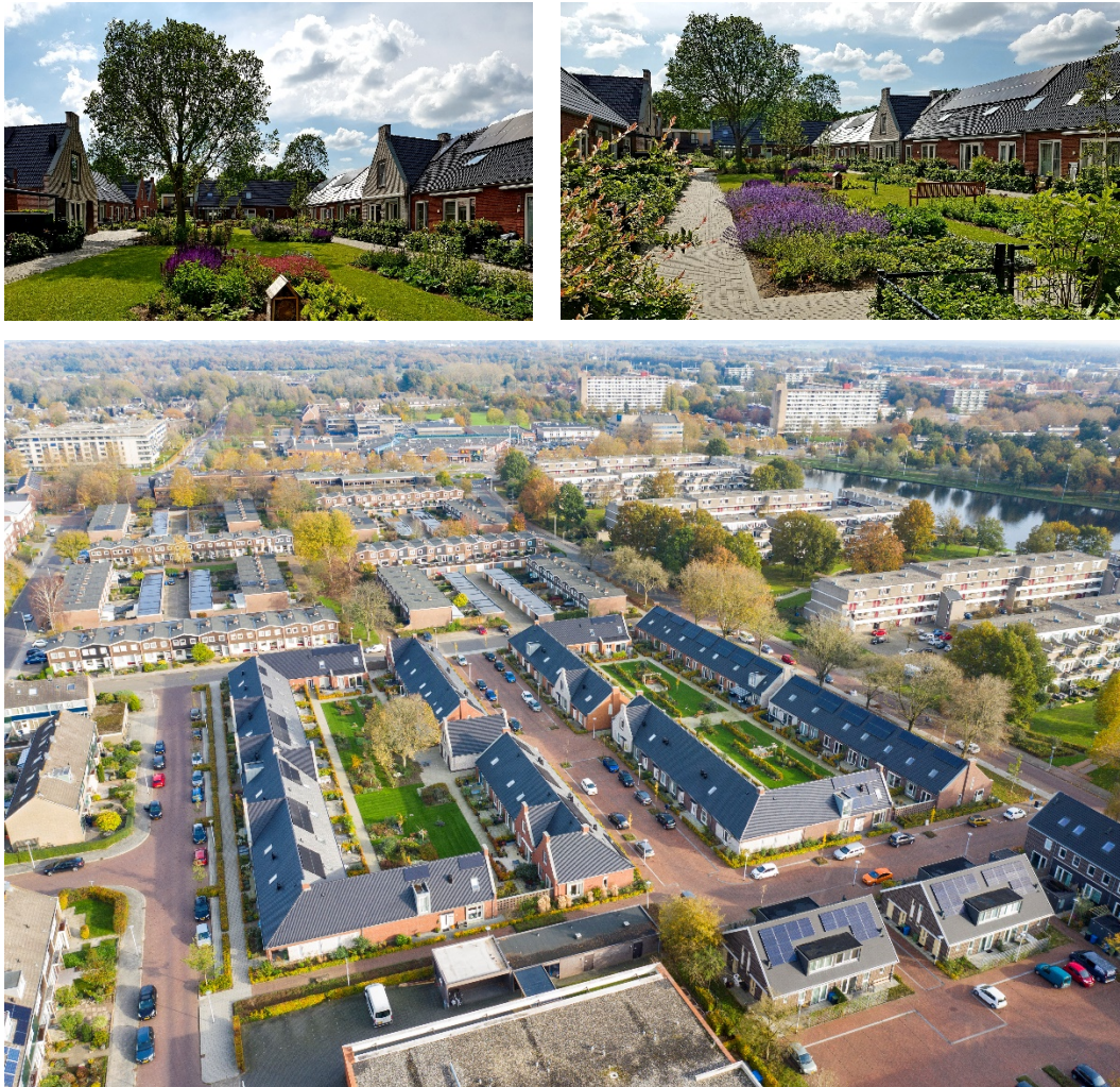
Figuur 2. Knarrenhof in Zwolle, een voorbeeld van Collectief Particulier Opdrachtgeverschap CPO met 48 gezinswoningen waarvan er 14 sociale huur. Ouderen verzilveren de overwaarde van hun koopwoning in de stad en zoeken de rust van de provincie. Bron: https://knarrenhof.nl/

Wat moet de rol van het ministerie of de minister zijn?