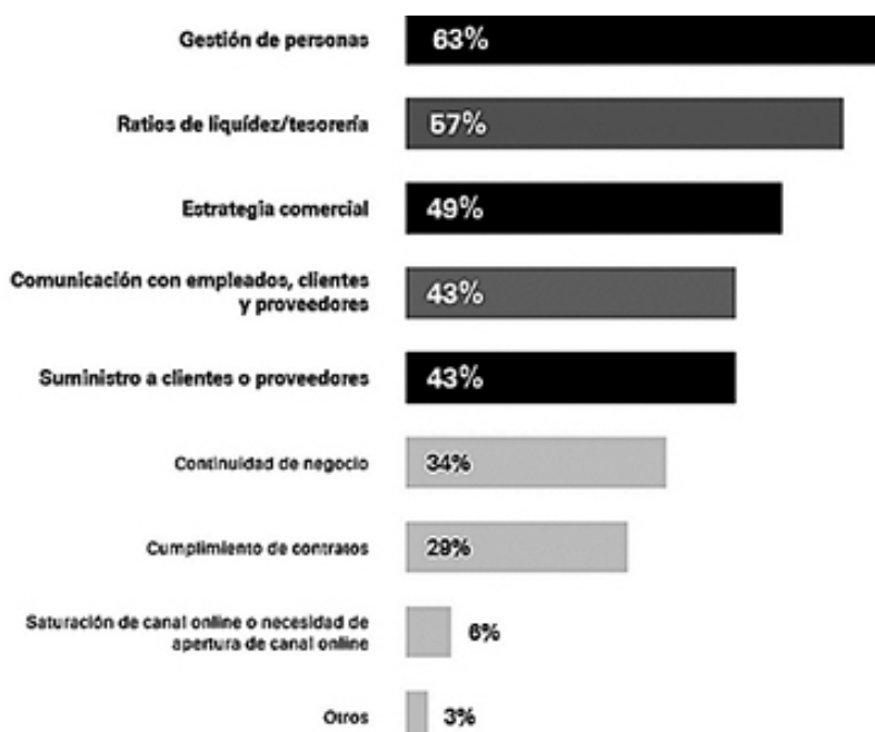
Figura 2. Áreas de las empresas que se ven afectadas por el coronavirus

Las empresas reflejadas en el informe anterior han visto afectados todos sus ámbitos de actividad y sus sistemas de funcionamiento por la COVID y también por las medidas del Gobierno para combatirla, tal y como puede apreciarse en la Figura 2.