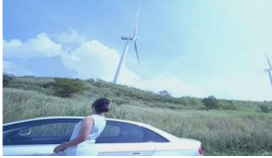
Fig. 7. “She’s a free and gentle flower growing wild.” Larawan ng mga hulíng eksena ng Wildflower mula sa Pep.ph.

At may kabatiran siya hinggil dito, kung isasaalang-alang ang mga hulíng tagpo ng serye. Muli’y nagdrive siya patungo sa may arko ng Poblacion Ardiente kung saan matatanaw din ang windmills ng bayan (Fig. 6). Nása tugatog na siya ng kapangyarihan, gaya ng ipinahihiwatig ng nakascore na theme song sa kaniyang internal na monologo, ang “Wildflower” na orihinal ng bándang Skylark noong 1972, sa cover ni Arnel Pineda, at may linyang lapat na lapat din para kay Lily Cruz: “She’s a free and gentle flower growing wild.” Sa kaniyang pagtanaw sa bungad ng bayang kaniyang binalikan upang mapabagsak ang mga Ardiente, at sa windmills na patuloy sa pag-ikot, tulad ng kaniyang búhay, sambit niya ang mga sumusunod: