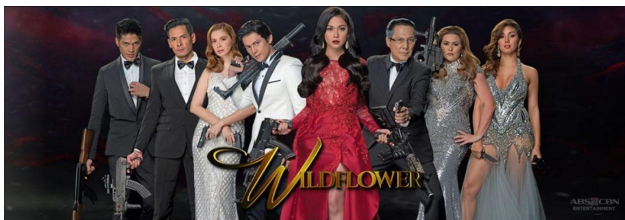
Pig. 1 Isang title card ng Wildflower sa temang battleroyale, tanghal ang cast ng palabas mula sa kaliwa: Vin Abrenica (Jepoy), Christian Vasquez (Dante), Sunshine Cruz (Camia), Joseph Marco (Diego), Maja Salvador (Lily Cruz/Ivy Aguas), Tirso Cruz III (Julio), Aiko Melendez (Emilia), at Roxanne Barcelo (Natalie).