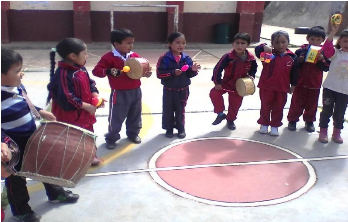
Niños tocando y cantando canciones.