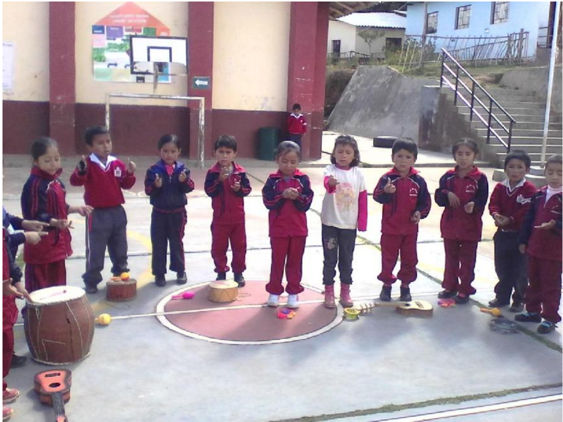
Niños tocando expresando sus ideas acerca de las canciones .