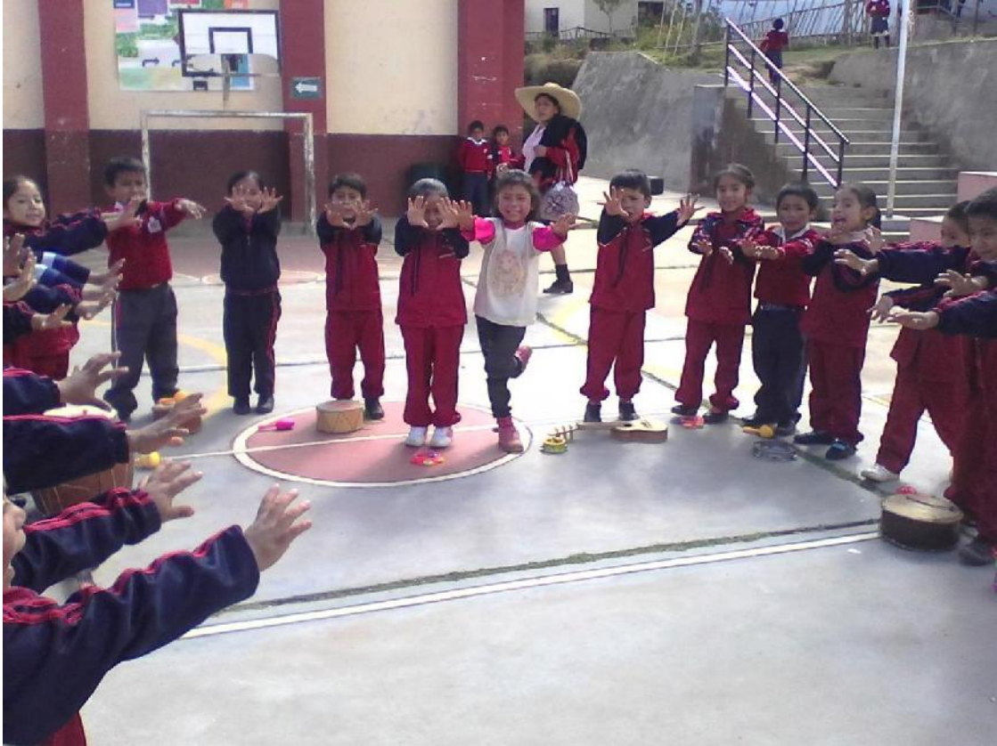
Niños pronunciando y contando las silabas de palabras