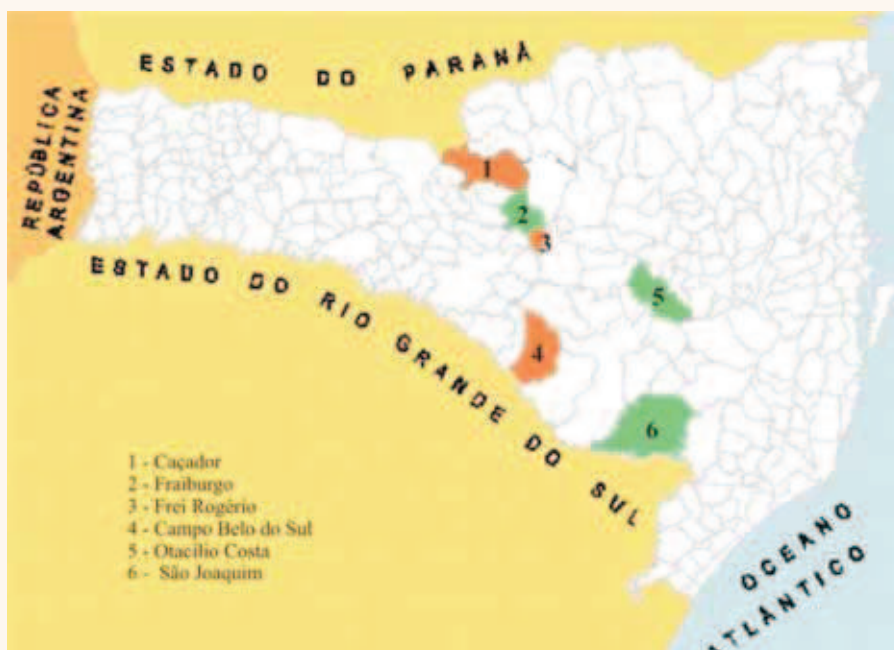
Figura 2. Municípios catarinenses produtores de pêra japonesa onde se procedeu ao levantamento de pomares. Ocorrência positiva (destaque alaranjado) e negativa (destaque verde) de sarna ( Venturia nashicola ) verificada nos anos de 1998 a 2004

Para o controle da doença recomenda-se o manejo integrado, tais como eliminação de frutos infectados, aplicação de uréia (2% a 5%) sobre a folhagem na entrada do outono, aplicação de calda sulfocálcica ou bordalesa em tratamento de inverno e pulverização com fungicidas IBEs, ftalimidas, ditiocarbamatos e guanidinas no início da primavera por ocasião da brotação nova. Antes de aplicar o fungicida deve-se verificar se este não é fitotóxico à cultivar de pêra em questão e o registro do produto no Ministério da Agricultura, Pecuária e Abastecimento – Mapa. A tabela de Mills, utilizada para o controle da sarna da macieira, também poderá ser usada para a previsão da sarna da pereira. As cultivares de pêra japonesa com valor comercial são todas suscetíveis à sarna (Ishii et al., 1992; Park et al., 2000).