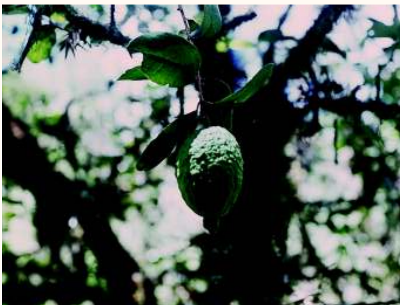
Figura 1. Fruto de goiabeira serrana naturalmente encontrada no interior dos ecossistemas “capões”

Exemplares de goiabeira serrana foram localizados entre 715 (Celso Ramos) e 1.692m de altitude (Urubici) (Tabela 1). Maior frequência foi observada nas altitudes entre 900 e 1.300m. Isto