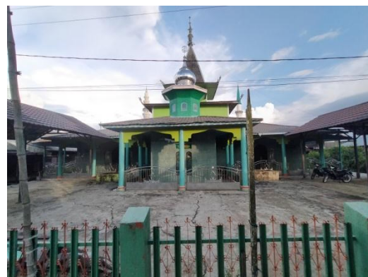
Tampilan Belakang Masjid Pusaka As