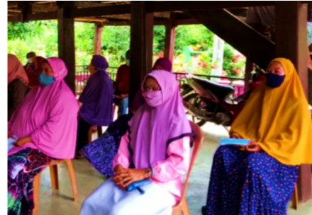
Gambar 4. Masyarakat Desa Bila, Kecamatan Sabbangparu, Kabupaten Wajo yang Mengikuti Penyuluhan