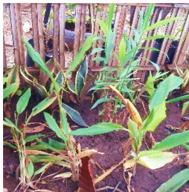
Gambar 7. Tanaman Kunyit

Hasil kegiatan penyuluhan mengenai penanaman dan pemanfaatan tanaman obat keluarga sebagai pencegahan Covid-19. Peserta penyuluhan ini dilakukan bersama masyarakat lingkungan sekitar sebanyak 15 orang dan Bidan Puskesmas Liu. Penyuluhan ini dilakukan agar masyarakat mampu menanam dan memanfaatkan tanaman obat keluarga seperti kunyit dan jahe sebagai obat tradisional agar tidak terkena paparan Covid-19. Setelah dilakukannya penyuluhan, tanaman obat keluarga mulai tumbuh subur di pekarangan rumah masyarakat dan masyarakat mulai memanfaatkan tanaman obat keluarga dalam meningkatkan imunitas tubuh.