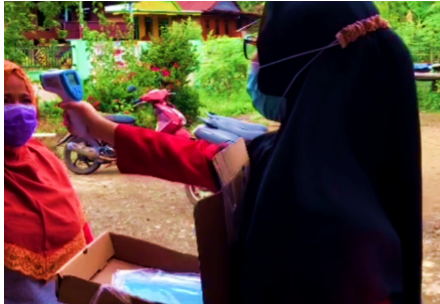
Gambar 1. Pembagian Masker

paparan Covid-19 yang dirangkaikan dengan pembagian masker. Sebelum dilakukan penyuluhan, terlebih dahulu dilakukan pemeriksaan suhu tubuh dan pembagian masker kepada masyarakat lingkungan sekitar. Setelah itu, barulah dilakukan penyuluhan dengan memberikan materi terkait penanaman kunyit dan jahe serta manfaat dari tanaman tersebut. Pemberian materi dilakukan dengan menampilkan materi dalam bentuk power point menggunakan LCD . Adapun alat dan bahan yang digunakan dalam pelaksanaan program kerja ini, yakni thermometer jidat, laptop, power point , LCD , spanduk, kursi dan meja.