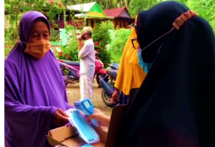
Gambar 2. Pemeriksaan Suhu Tubuh