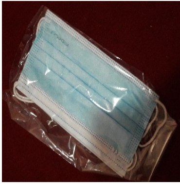
Gambar 11. Masker