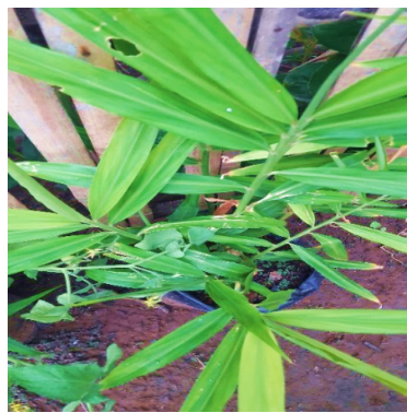
Gambar 8. Tanaman Jahe