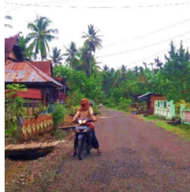
Gambar 5 dan 6. Penggunaan masker oleh masyarakat setelah dilaksanakannya kegiatan pembagian masker

Hasil kegiatan penyuluhan mengenai penanaman dan pemanfaatan tanaman obat keluarga sebagai pencegahan Covid-19. Peserta penyuluhan ini dilakukan bersama masyarakat lingkungan sekitar sebanyak 15 orang dan Bidan Puskesmas Liu. Penyuluhan ini dilakukan agar masyarakat mampu menanam dan memanfaatkan tanaman obat keluarga seperti kunyit dan jahe sebagai obat tradisional agar tidak terkena paparan Covid-19. Setelah dilakukannya penyuluhan, tanaman obat keluarga mulai tumbuh subur di pekarangan rumah masyarakat dan masyarakat mulai memanfaatkan tanaman obat keluarga dalam meningkatkan imunitas tubuh.