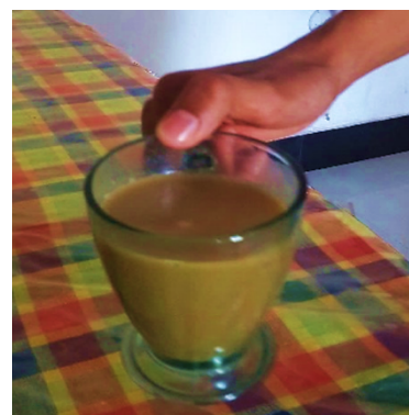
Gambar 9 dan 10. Sarabba Sebagai Minuman Tradisional Peningkat Imunitas Tubuh

Adapun luaran yang dicapai dalam pelaksanaan program kerja Kuliah Kerja Nyata (KKN) adalah sebagai berikut: