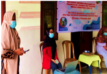
Gambar 3. Penyuluhan Mengenai Tanaman Obat Keluarga Sebagai Pencegahan Covid-19