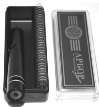
Рис. 1. Тест-мікроскоп “Арбор Еліт”

З метою визначення оптимального часу осіменіння у сук використовували тест-мікроскоп “Арбор Еліт”, який складається з власне міні-мікроскопа та набору предметних скельць (рис. 1).