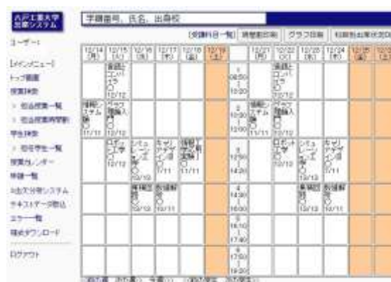
図1 2週間分の出席状況表示画面例

本学では、実験や実習などの体験型学習教科では出席回数が学習効果の良し悪しと結びつく効果に着目し、複数教室による計算機実習の科目においてできるだけ簡潔に出席状況を把握する目的で、1990年よりバーコードを使用した出席管理システムを構築し運用されていた 1) 。また、その後の少子化による多様な学生の入学状況の進展に伴い、単なる出席管理のみならず、学生