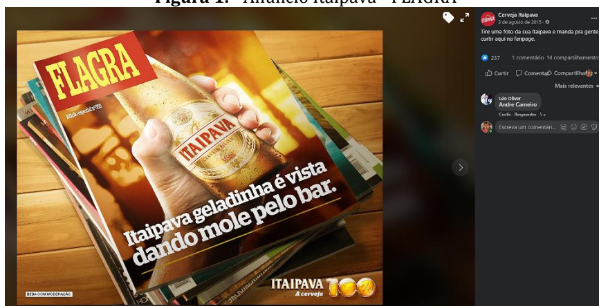
Figura 1. - Anúncio Itaipava - FLAGRA