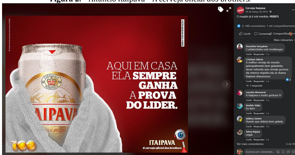
Figura 2. – Anúncio Itaipava – A cerveja oficial dos brothers.

O texto abaixo (figura 2) trata-se de um anúncio da empresa de bebidas alcoólicas Itaipava. Tem como objetivo, como toda peça publicitária, a divulgação e a venda de seu produto, neste caso, a cerveja, utilizando-se, para isso, de uma série de elementos semióticos multimodais (cores, imagens) e verbais que incidem sobre a opinião do público-alvo. Como aponta Sousa (2017, p. 139), “a linguagem verbal e a linguagem visual promovem um grande diferencial no texto escrito ou oral, o que garante o sucesso da comunicação”, assumindo a imagem, no anúncio publicitário, um importante recurso argumentativo na busca da textualidade.