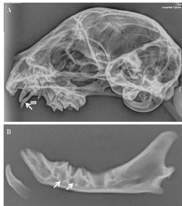
Figura 2. Radiografia lateral esquerda do crânio de gato-do-mato-pequeno ( Leopardus guttulus ). O dente decíduo (seta) ocupa a maior parte do alvéolo, prejudicando a projeção do canino definitivo (*) (A). Radiografia lateral esquerda da mandíbula. Notar a projeção dos pré-molares (setas) (B).

1996), cachorros-do-mato (Rossi Junior et al., 2013), morcegos (Rui e Drehmer, 2004), gambás (De Moraes et al., 2001), mão-pelada (Silva e Quintela, 2011; Bianchi et al., 2013), cachorros (Gaspar e Amaral, 1995; Lacerda et al., 2000), cavalos (Dixon et al., 2005) e gatos (Gawor e Niemiec, 2014; Langley-Hobbs et al., 2015). Aghashani et al. (2016), estudando crânios de lince-pardo ( Lynx rufus californicus ), identificou a persistência de três incisivos mandibulares em duzentos e setenta e sete crânios analisados, sendo um crânio com dois dentes persistentes e um crânio com apenas um dente persistente.