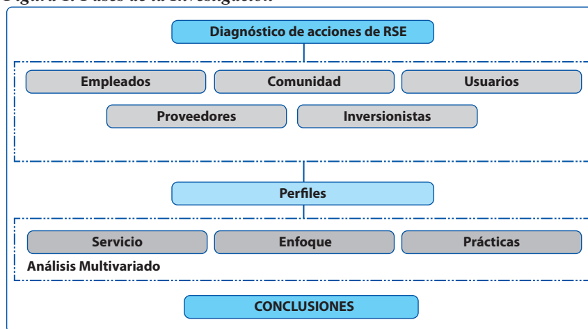
Figura 1. Fases de la Investigación

Posterior a ello se realizó un análisis cuantitativo para determinar la correspondencia entre las diferentes empresas determinado si existían tendencias que permitieran definir perfiles de RSE para estas entidades, este proceso se realizó a través de los resultados que arrojó la encuesta por medio de una técnica de análisis multivariable elaborado con el programa Numerical Taxonomy System (NTSYS) (6).