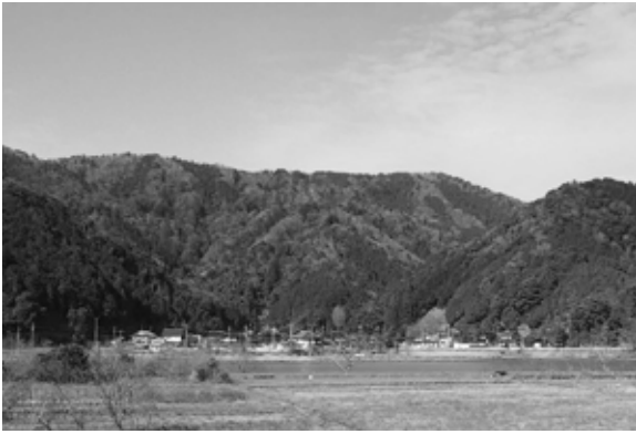
写真1 和江集落遠景（東から）