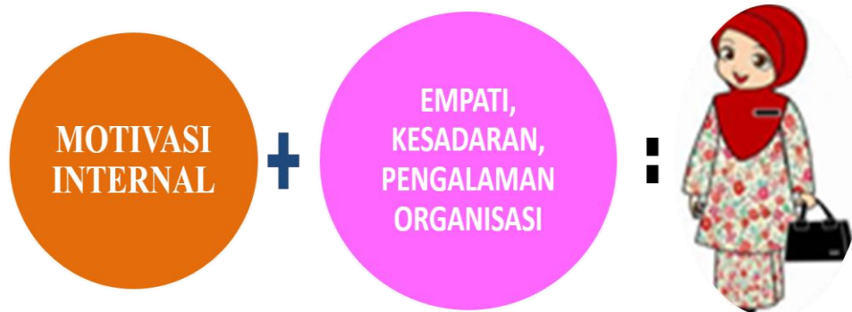
Gambar 1.1 Motivasi Internal menjadi Anggota Legislatif