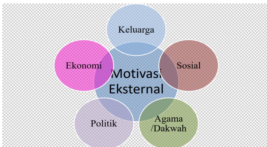
Gambar 1.2 Motivasi Eksternal Menjadi Anggota Legislatif

Di bawah ini gambar 1.2 merupakan ilustrasi motivasi eksternal menjadi legislator perempuan :