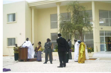
Discours du Premier Ministre (Macky Sall) sur le parvis du CRCF