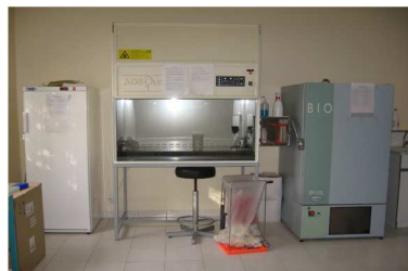
Équipements du laboratoire