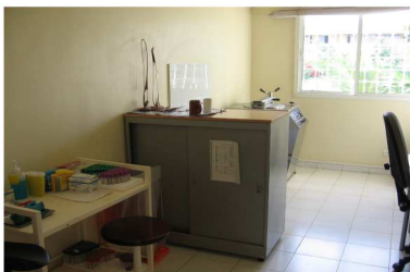
Salle de prélèvement