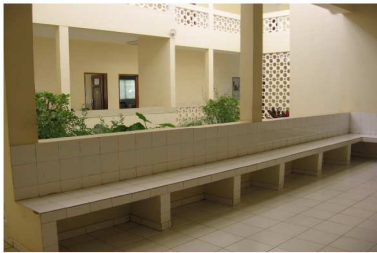
Espace d'attente des patients