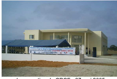
Inauguration du CRCF - 27 mai 2005