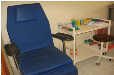
Salle de prélèvements