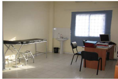
Cabinet de consultation