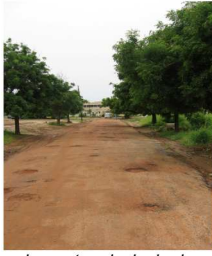
La route principale du CHNU de Fann qui mène au CRCF