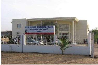
Le CRCF en 2006