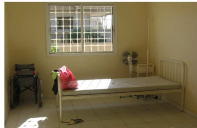
Salle d'hospitalisation de Jour