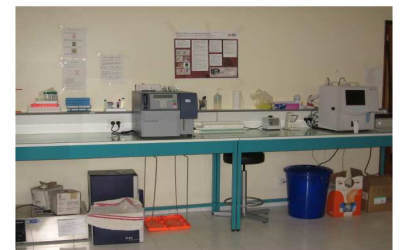
La paillasse du laboratoire