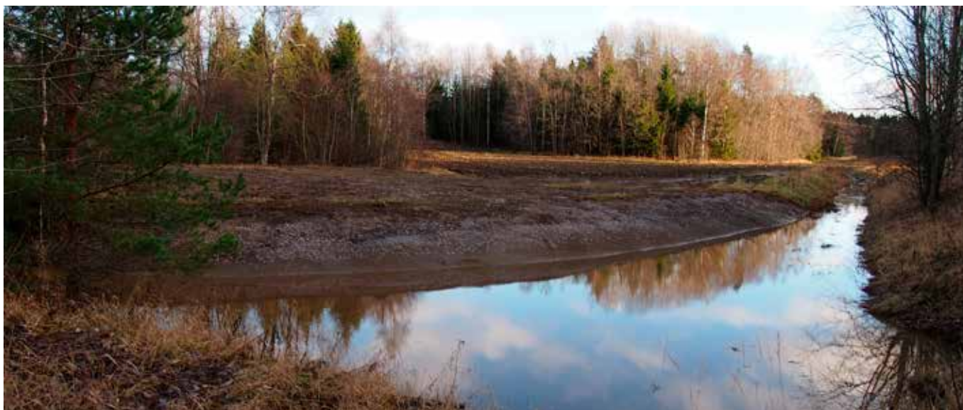
Med hjälp av miljövänliga åtgärder såsom anläggning eller naturlig restaurering av jordbruksfåror genom att göra flackare slänter (ses på bilden), små våtmarker eller översvämningssområden, kan man exempelvis minska översvämningsskador. Detta gynnar även åkerarrendatorn.

Täckdikning eller då dikningen förnyas på ett skifte är en betydande investering (3000–4000 €/ha, Pulkka 2013) som ökar åkerns handelsvärde med 20–25 procent (Peltola m.fl. 2005). Ibland räcker det med ett enskilt tilläggsdike på ett vått ställe på åkern. Även spolning av täckdiken kan komma i fråga för att förbättra dikningens funktion. Det finns skäl att granska täckdikenas utlopp och förhindra mark kring utloppen att rasar. Dessutom kan buskars och trädets rotsystem täppa till rören. Det är dock inte alltid som störningen är direkt förknippad med täckdiket. Störningen kan också bero på markpackning som hindrar att vattnet snabbt kan rinna ut i täckdiket. Då ska man försöka luckra upp marken till exempel med hjälp av de växter man väljer odla.