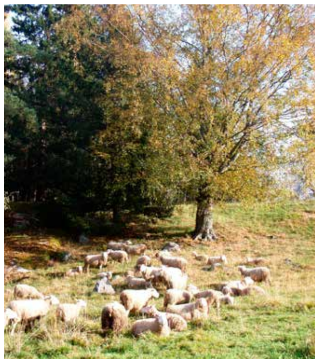
Vid arrendering av områden utanför åkern, såsom vårdbiotoper, skall man i avtalet fästa särskild uppmärksamhet vid åtgärder som skall utföras i området samt vid villkoren för ett eventuellt miljöstödet.

Gräset från skyddszonerna kan tyvärr inte alltid utnyttjas. Då kan skyddszonen bli en belastning för odlaren så att inte ens den möjliga ersättning som odlaren får täcker alla kostnader. Om arrendatorn vill ha skyddszoner på sitt område i vattenskydds- och mångfalds syfte, bör arrendegivaren beakta kostnaderna i arrendebeloppet.