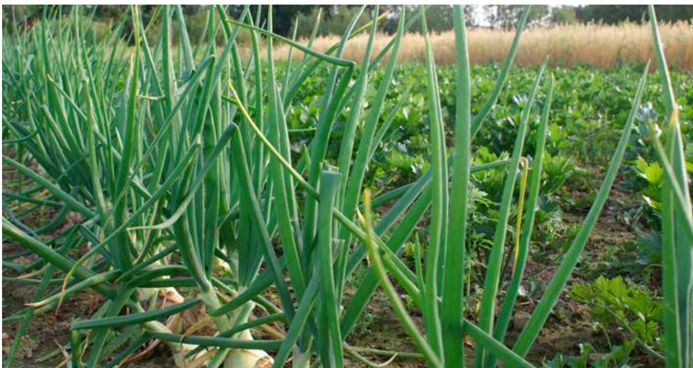
Vid odling av trädgårdsväxter är det ofta en fördel att ha möjlighet till bevattning.

I synnerhet de som odlar trädgårdsväxter och potatis kan vara intresserade av att använda bevattningsvatten för frostbekämpning eller för den ordinarie bevattningen. Om det på åkerskiftet finns möjlighet att använda vatten ska frågor med anknytning till detta avtalas i förväg. Vid uttag av vatten från någon annans vattenområde krävs alltid samtycke av vattenområdets ägare. När vatten används ska man fråga miljöförvaltningsmyndigheten om man behöver ett tillstånd för uttag av vatten. Enligt vattenlagen (587/2011) krävs tillstånd om utta-