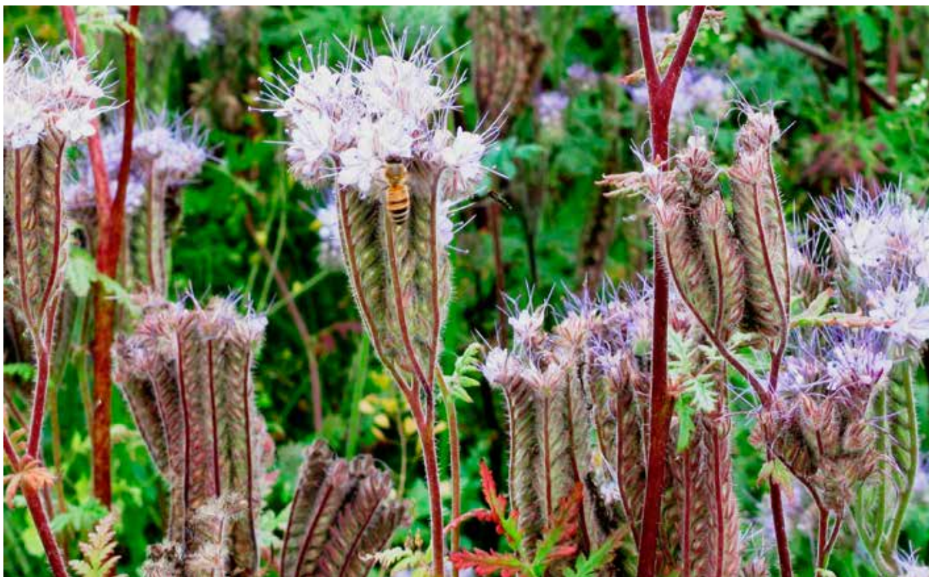
Mångsidig växtföljd, fånggrödor, växter med djupa rötter och grüngödsling är exempel på odlingsåtgärder som förbättrar markkvaliteten. Dessa åtgärder kan också användas för att minska markpackningen.

Guiden är i synnerhet riktad till sådana arrendegivare som inte i sin vardagliga verksamhet sysslar med arrendegivning och frågor förknippade med åkerns markkvalitet. Guiden innehåller också tips för arrendatorer om sådant som man bör beakta vid arrendering av mark.