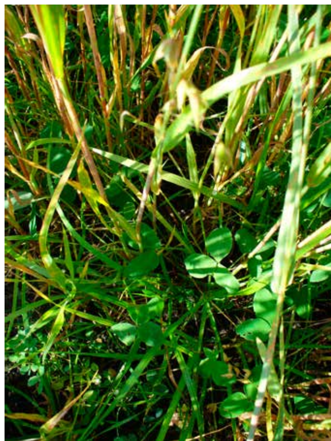
Bottengrödan ser ännu klenvuxen ut under spannmålet, men efter tröskningen täcker vallblandningen åkern med grönska.

Exempelvis tidigt korn passar bra att odla det år då bottengrödan sås, eftersom bottengrödan bör få tillräckligt med tid att växa på hösten. I juni-juli går nästan all solenergi åt till skördeväxten och nästan ingen energi när bottengrödornas blad. Efter att odlingsväxten har skör-