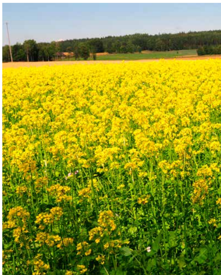
Vitsenapen blommar gul som mellangröda till sockerbeta.

Vitsenap som är motståndskraftig mot cystnematoder kan också odlas för fröskörd. Då genereras inkomst även under mellanåret utan sockerbetsodling. Bekämpningen av cystnematoder är effektiv eftersom växten som minskar mängden cystnematoder växer på skiftet hela sommaren, i motsats till metoden med spannmål + rättika/senap. Spannmålet minskar cystnematoderna i betydligt mindre utsträckning än de rättika- och senapsarter som har konstaterats vara framgångsrika i bekämpningssyfte. Vid bekämpning av vissnesjuka måste växtligheten slås när den är som mest frodig och arbetas ner i marken så snart som möjligt efter slåttern för att senapssyran som växtligheten bildar ska ha någon effekt mot sjukdomsalstrarna.