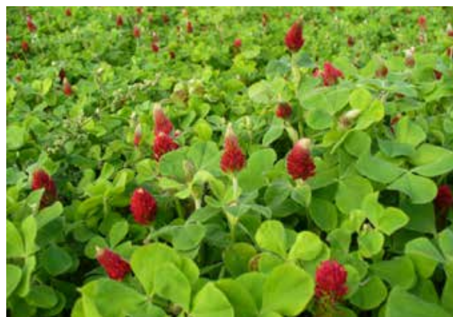
När blodklövern börjar växa kan den ha nytta av en liten mängd kvävegödsel, men växtligheten binder effektivt det kväve ur luften som behövs för tillväxten. Överdriven kvävegödsling gör bara att ogräset växer snabbare.

Grüngödslingsförmågan hos växtlighet som sås som bottengröda beror i stor utsträckning på hur täckande skördeväxtligheten är. Alltför frodig växtlighet suger i sig nästan all solenergi och bottengrödan växer mycket långsamt tills skördeväxten börjar mogna. Således bör såddtätheten och gödningen vara en aning måttfullare än normalt. Båda kan minskas med 10-20 procent jämfört med de normala mängderna. Å andra sidan får skördeväxtligheten inte vara för gles, för att bottengrödan inte ska ta över och försvåra skörden av skördeväxten. Bland annat rödklövern har en tendens att växa sig för hög under gynnsamma förhållanden.