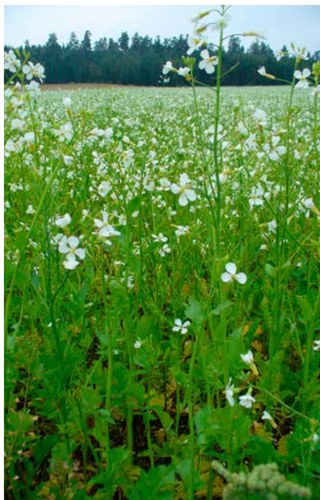
En växtlighet med oljerättika binder i sin stora växtmassa kväve som inte har utnyttjats av potatisen och förhindrar effektivt erosion.