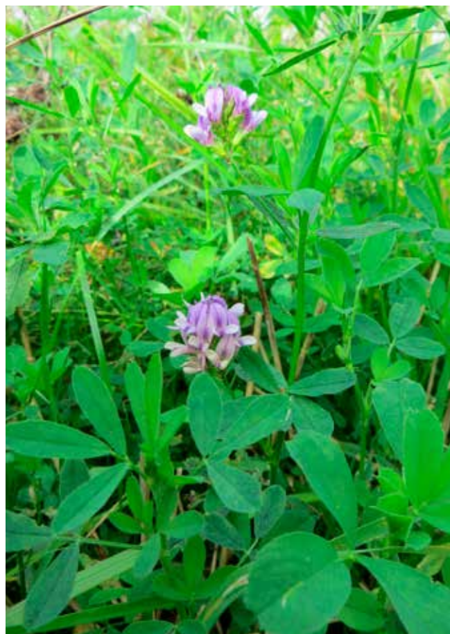
Blålusern bildar ett djupt rotsystem och binder kväve som kan användas av följande odlingsväxt. Bild Janne Heikkinen.

Förfruktsvärdet kan också innefatta andra effekter än en förbättring av markkvaliteten eller värdet av det kväve som blir kvar i marken. Exempelvis minskar oljeväxter växtskydds- och bearbetningsbehovet för vete som följer oljeväxterna i cirkulationen.