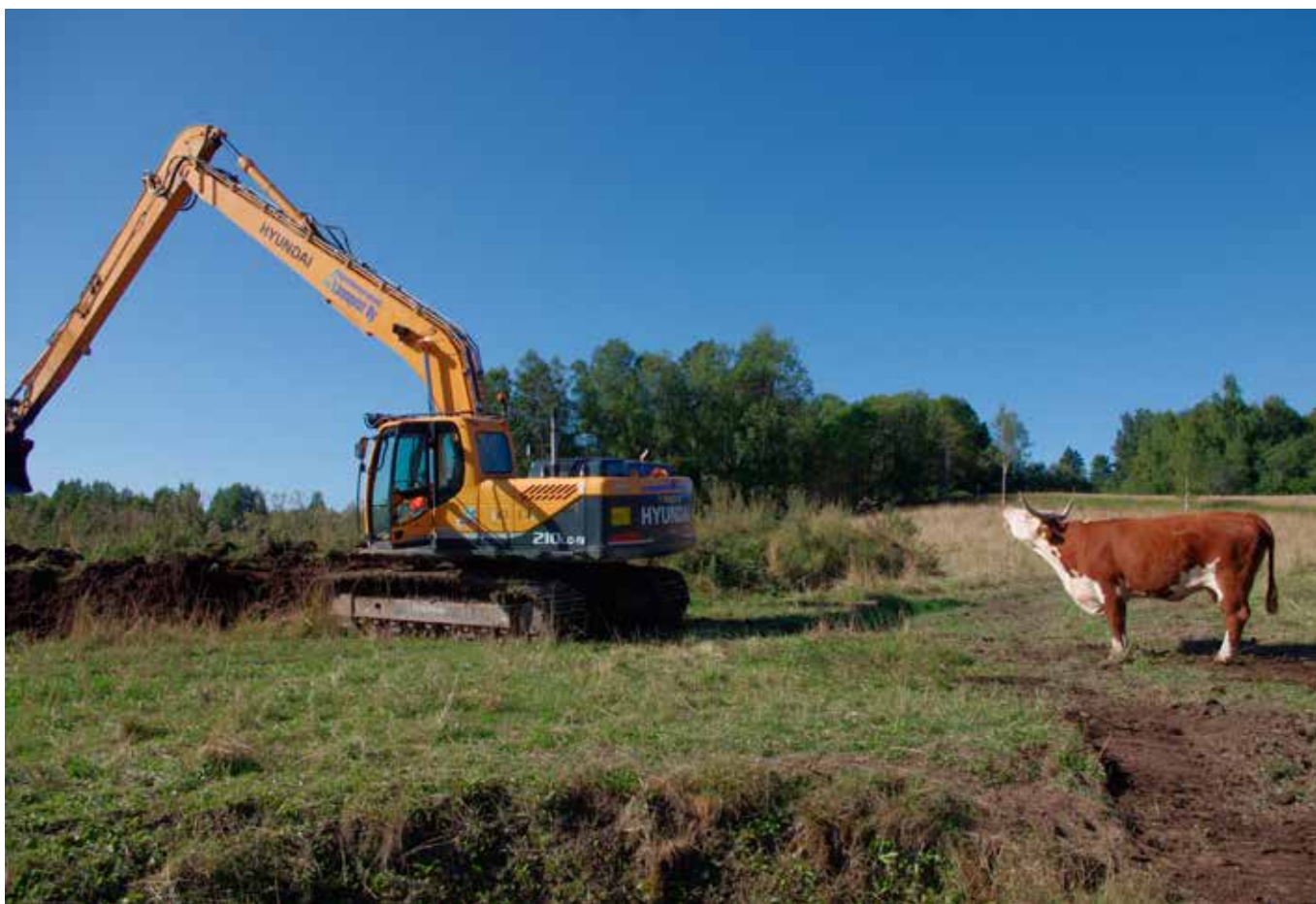
Hereford-karja laidunsi Kruusilan kosteikon vierisellä suojavöhykkeellä kesällä 2013. Laidunnuskauden aikana rakennettiin kosteikon toista vaihetta, mutta se ei aiheuttanut ongelmia karjalle, sillä käytössä oli runsaasti vapaata laiduntilaa myös muualla.