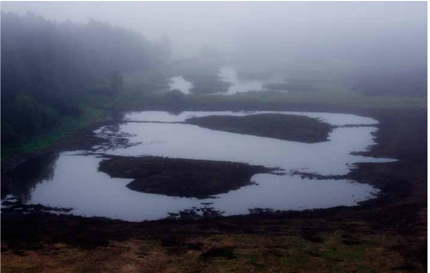
Kosteikkoa laajennettiin syksyllä 2013 kahdella uudella osalla.

Tiedotusta olisi voitu parantaa myös hankkeen toisessa vaiheessa. Kesällä 2013 Hirsijärvellä oli kalakuolemia, ja joillakin paikallisilla asukkailla heräsi epäily, että kalakuolemat liittyvät kosteikon laajentamiseen. Todellisuudessa kosteikon uudesta osasta ei ollut tällöin vielä yhteyttä jokeen, joten asioilla ei voinut olla tekemistä keskenään. Selkeä tiedotus kosteikkohankkeen toisen vaiheen alkaessa 2013 olisi voinut jälleen ehkäistä väärinkäsityksiä.