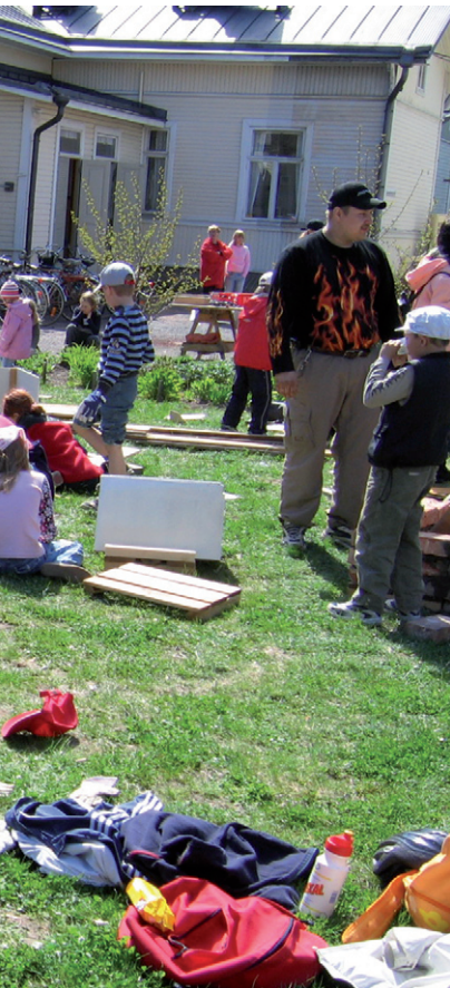
Lasten rakennuspaja rakennuskulttuuritalo Toivon pihamaalla Porissa.