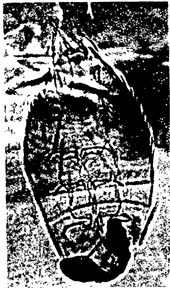
FIG. 2. -- La même larve à plus fort grossissement.