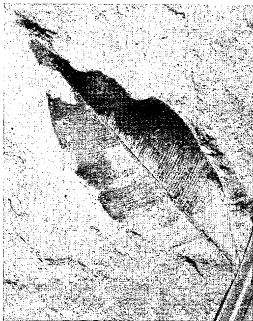
FIG. 1. — Guttifère : Calophyllum — 5 × 1,8 cm — n° 3826, Falan I, Tolima, Colombie.