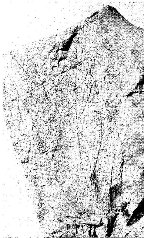
FIG. 2. — Elaeocarpacee : Muntingia — 8 × 2,5 cm — n° 3855, Hato grande, Tolima, Colombie.