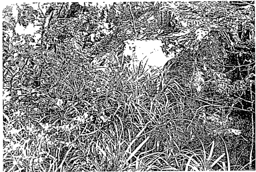
Pl. 3. — Pandanus biceps Stone et Guillaumet dans l'éboulis occidental de l'Ankarana de Diégo-Suarez, N. W. Madagascar.