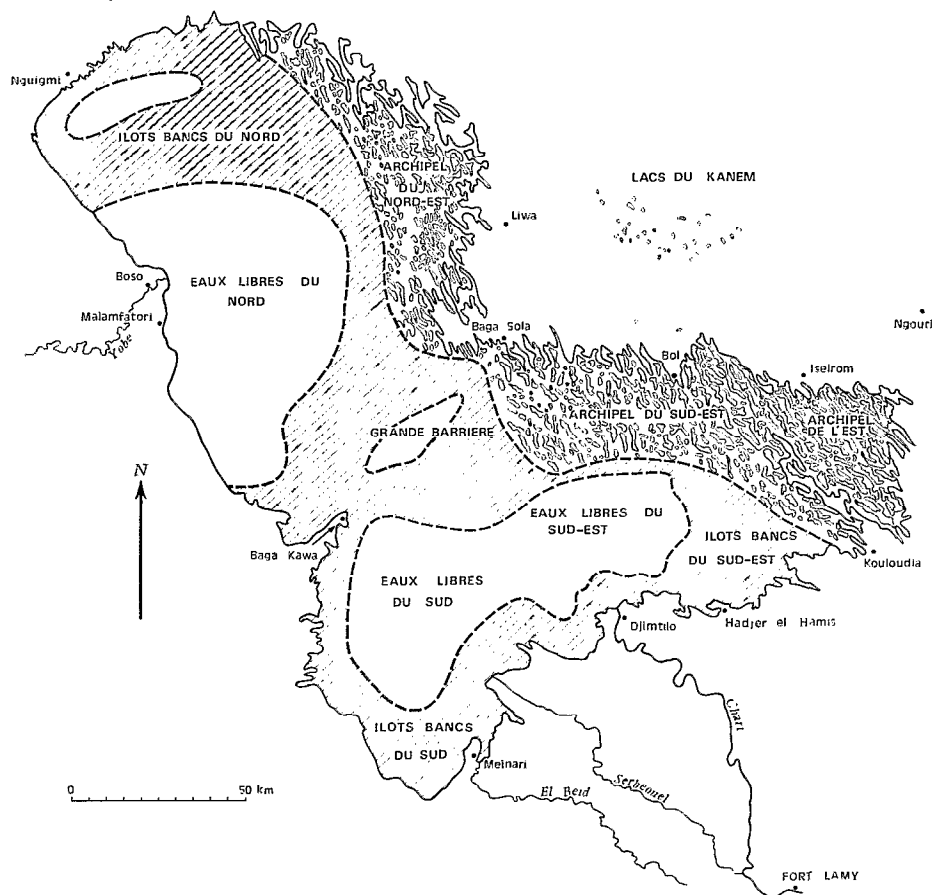
Fig. 1. — Grandes régions naturelles du Lac Tchad.

La façon la plus simple de décrire le milieu est de l'assimiler à un système en état d'équilibre permanent de manière à définir les débits d'entrée et de sortie des eaux et des principaux constituants de la salure ainsi que leur temps de séjour dans ce milieu. Cette méthode est d'autant plus justifiable que la chimie des eaux naturelles dépend davantage de la cinétique des réactions physico-chimiques et biochimiques que des conditions d'équilibre thermodynamique. En toute rigueur, le lac Tchad n'est pas assimilable à un système en état d'équilibre permanent, étant donné les écarts saisonniers et inter-annuels entre les débits d'apport et de perte des eaux et des sels. En fait, il est possible de définir un modèle « statistique » qui est d'autant plus proche du modèle idéal que les données de calcul couvrent une longue période. En partant de ce modèle, nous avons tenté dans une première approche de décrire la dynamique des principaux sels et de prévoir l'évolution de la salure des eaux lorsque le système