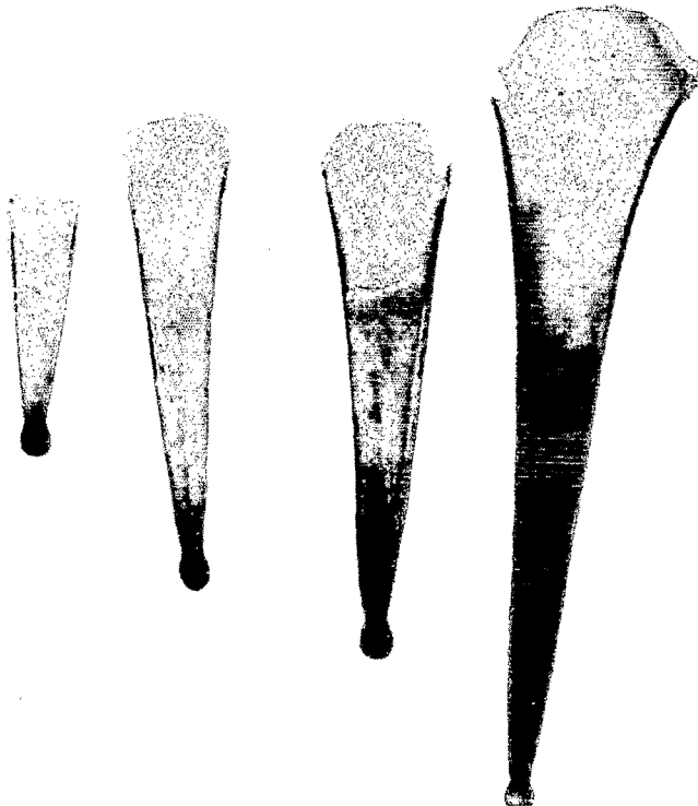
Fig. 7. — Diacria trispinosa : coquilles juvéniles.