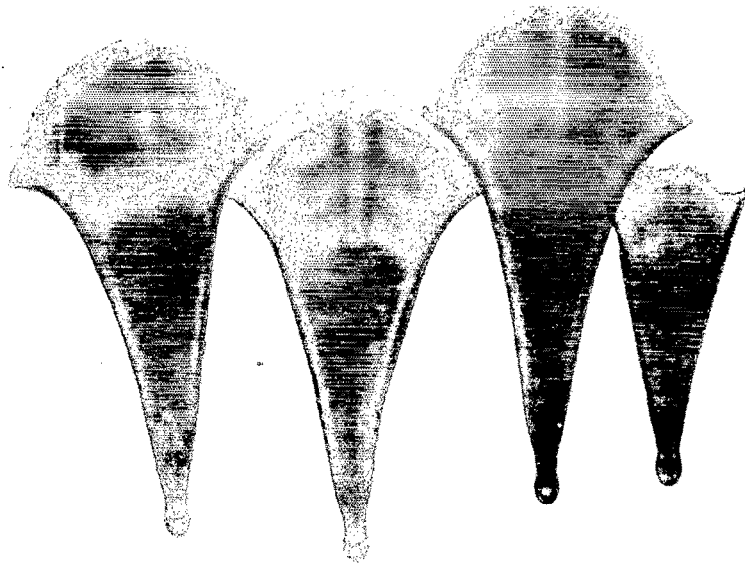
Fig. 5. — Diacria quadridentata quadridentata : coquilles juvéniles.