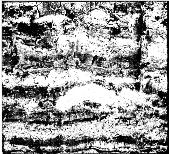
FIGURE 2 Magadiite sous son faciès nodulaire (diagenèse précoce).

Une autre originalité apparaît en fonction de l'aération et du drainage des dépressions interdunaires (C. Cheverry, 1971; G. Maglione, 1970). Dans le cas des milieux mal drainés, les sulfates sont bloqués à l'état de sulfures par réduction sulfato-bactérienne: la paragenèse est carbonatée-sodique.