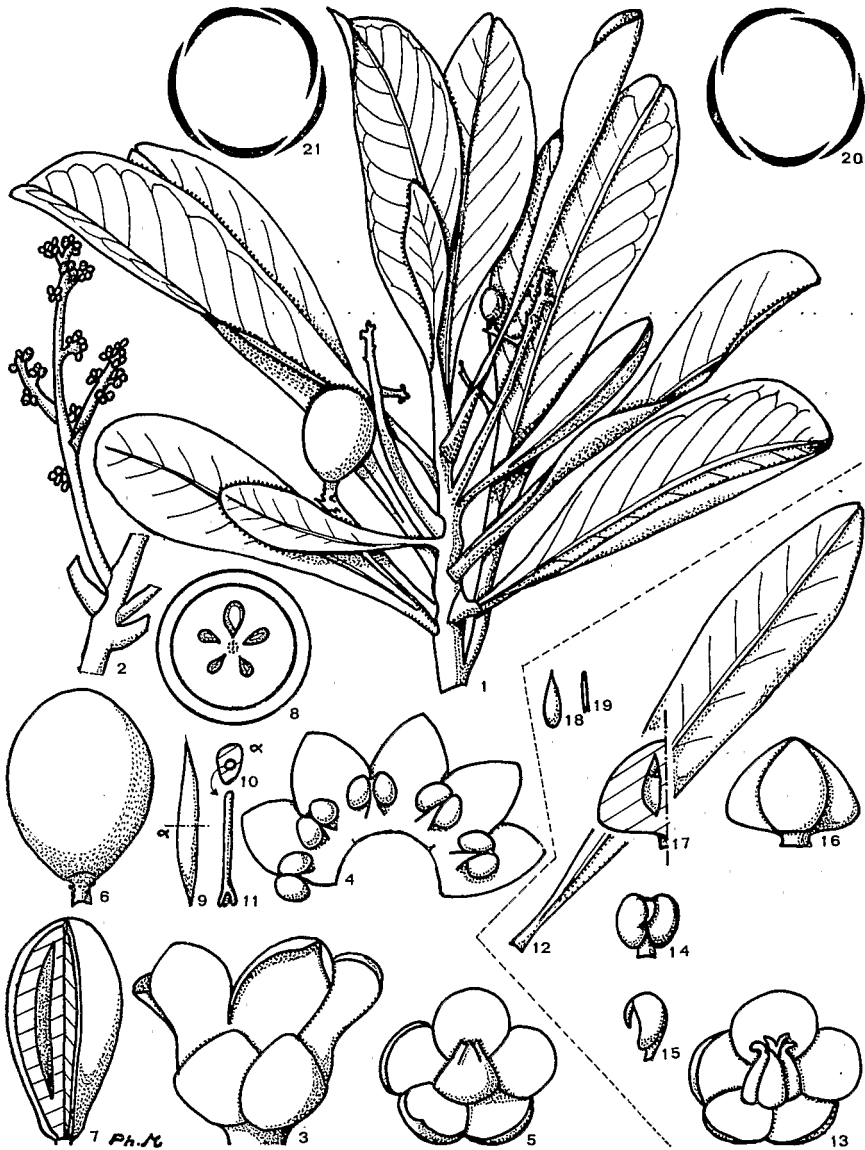
Pl. 1. — Oncotheca macrocarpa : 1, rameau fructifère ; 2, inflorescence ; 3, fleur ouverte ; 4, corolle avec étamines ; 5, calice et ovaire ; 6, 7, fruits (forme ellipsoïde et allongée) ; 8, fruit en coupe avec loges de l'ovaire ; 9, 10, graine (profil et coupe) ; 11, embryon. — Oncotheca balansæ Baillon : 12, feuille ; 13, calice et ovaire ; 14, 15, étamine (face et profil) ; 16, 17, fruit (profil et coupe) ; 18, graine ; 19, embryon ; 20, 21, préfloraison quinconce (D et S).