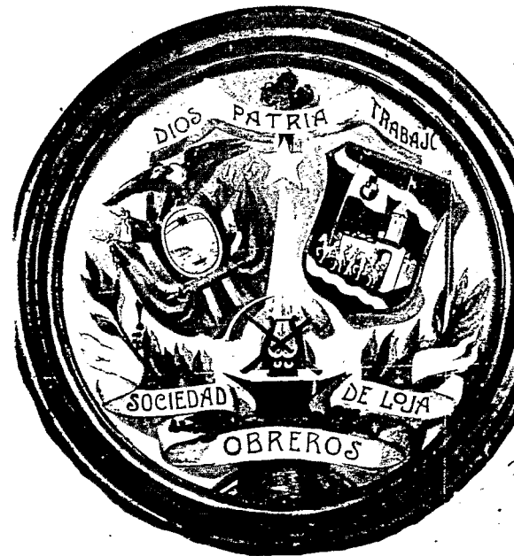
Emblème de la Société "Obreros de Loja". Fondée en 1915, elle comptait 105 membres en 1920; la "Unión Obrera" fondée en 1907, en comptait 75 à la même époque. Toutes deux étaient d'inspiration catholique.

Le projet d'une grande "Région Australe" a d'ailleurs été repris au profit de Loja. Sa dernière expression — la plus engagée dans les faits, aussi, — s'incarne dans la politique régionale définie par l'actuelle direction de PREDESUR. Le "Programme Régional pour le Développement du Sud de l'Equateur" est un organisme public de développement qui vise à concentrer et à coordonner les efforts des diverses entités étatiques qui travaillent dans les provinces de l'extrême Sud équatorien (Loja, El Oro et Zamora Chinchipe). PREDESUR est devenu, surtout avec sa nouvelle direction, un outil essentiel pour la structuration d'une grande région économique englobant ces trois provinces et dont Loja serait le centre nerveux. Dans cette perspective, l'organisme s'est décentralisé à Loja — non sans de très vives résistances — et développe une stratégie consciente pour arracher à ce qui reste de l'oligarchie locale le contrôle de la province de Loja et du futur ensemble régional.