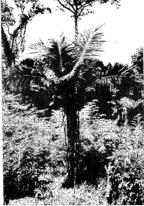
Fig. 1. — Astrocaryum triandrum . Hábito.