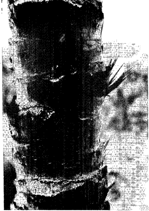
Fig. 2. — Astrocaryum triandrum . Tallo.