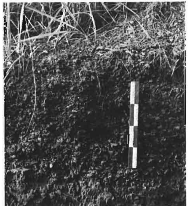
Photo 2 : Ngoulonkila I. Coupe stratigraphique d'un ferrier. La couche à déchets de fonte. Unité : 10 cm.