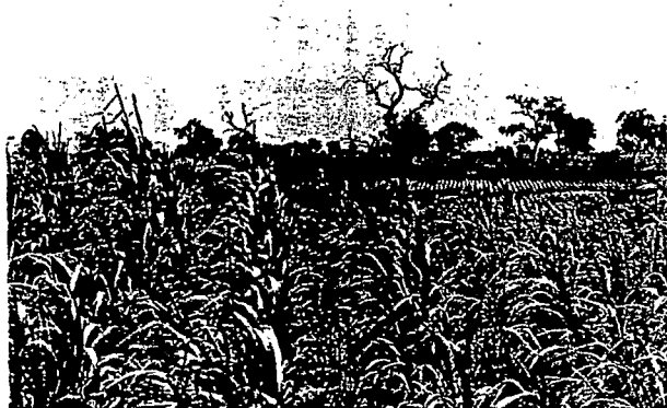
Arrière-effet sur céréale : à gauche, DBCP + fumure — à droite, DBCP (After-effect on cereal : left, DBCP + fertilizer — right, DBCP)