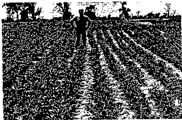
Effet direct : à gauche, DBCP + fumure — à droite, DBCP (Direct effect : left, DBCP + fertilizer — right, DBCP)