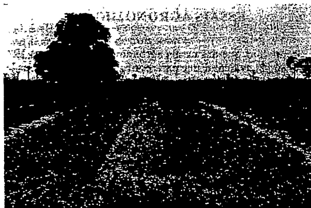
PHOTO 2. — Au premier plan, à droite : parcelle recevant 150 kg de 6.20.10 et 150 kg de phosphogypse par hectare. A gauche, la parcelle bénéficie en plus de l'inoculation par rhizobium (souche S10) au semis — (Right foreground. plot receiving 150 of 6.20.10 and 150 of phosphogypsum per hectare. On the left, the plot also benefits from rhizobium inoculation (strain S10) at the time of sowing)