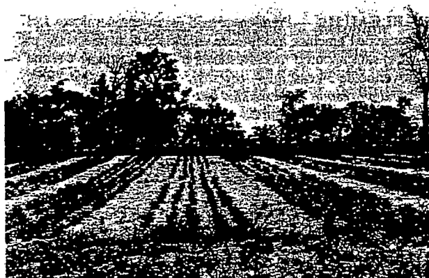
PHOTO 1. — Effet de l'inoculation. les trois parcelles au 1er plan reçoivent 150 kg/ha de 6.20.10 et 150 kg/ha de phosphogypse. Celle de gauche est en plus inoculée avec la souche S10, celle de droite, avec N22V1. — (Inoculation effect. The three plots in foreground receive 150 kg/ha of 6.20.10 and 150 kg/ha of phosphogypsum. The plot on the left is also inoculated with strain S10, the one on the right with strain N22V1)