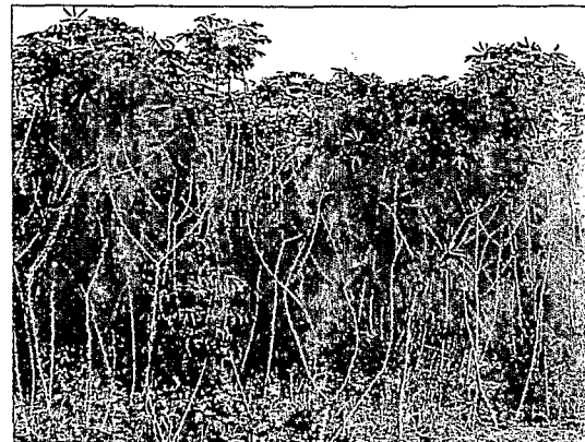
Champ de manioc dans la région de Bouansa (Congo).

Les acides propionique et butyrique sont produits, quant à eux, par une flore anaérobie stricte au sein de laquelle les clostridies, et notamment Clostridium butyricum , jouent un rôle important. Ces dernières peuvent d'ailleurs se développer en début de processus grâce à la flore lactique hétérofermentaire qui maintient le pH du milieu aux environs de 5. La prédominance des bactéries lactiques empêche la prolifération de bactéries patho-