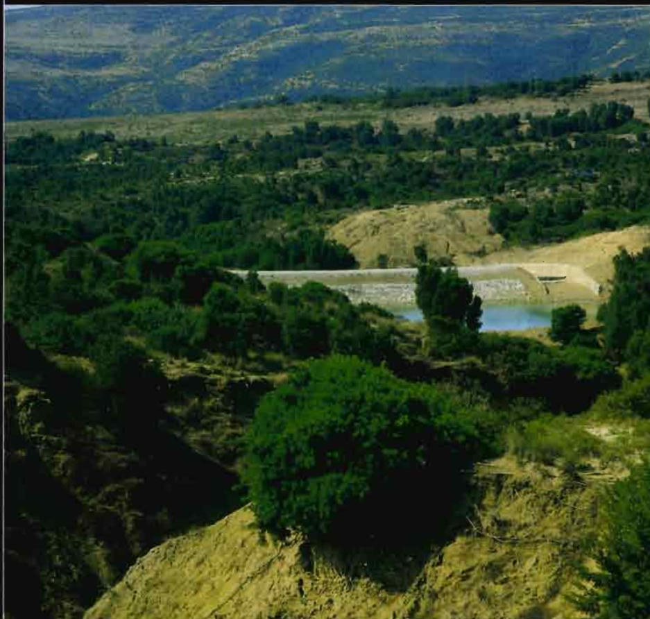
Vue plongeante sur lac collinaire avec protection arbustive

compagnés d'une aide importante de la communauté européenne et d'organisations internationales. Conçues initialement pour retarder l'envasement des grands barrages, ces retenues collinaires ne peuvent plus être considérées comme assumant la seule fonction conservatoire. Elles sont un élément central d'une politique de développement rural au bénéfice des populations locales directement concernées par ces nouveaux réservoirs d'eau. Ainsi, les missions d'étude de la CES se trouvent élargies à la connaissance d'un nouvel état hydrologique, à la prise en compte de l'organisation des unités de production agricole, à une analyse des réactions et aux comportements paysans et plus globalement à une évaluation de l'impact sur la vie économique et sociale de la petite région. C'est dans le cadre de cette politique que l'Orstom inscrit et développe une thématique pluridisciplinaire de recherche associant des points de vue du pédologue, de l'agronome et du sociologue.