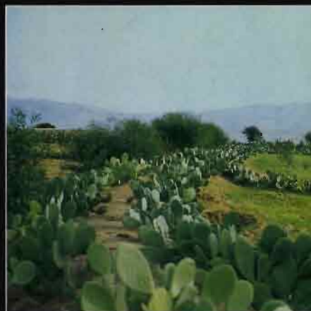
Vue de détail de tabias (dignes de terre) végétalisées par le cactus inerme et l'acacia

La Tunisie a réalisé à ce jour plus de 250 infrastructures de ce type dont la capacité varie de 20 000 à 150 000 m 3 ; elle