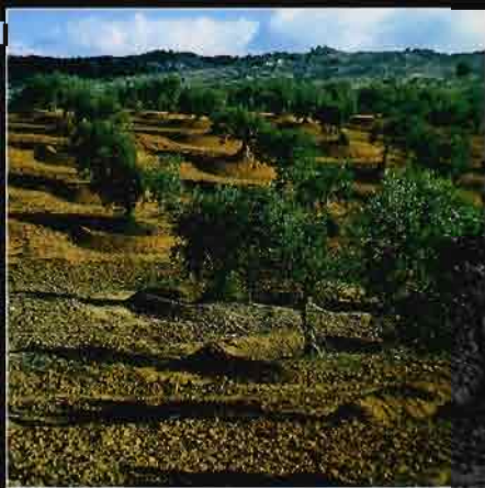
Vue de détail d' sodos (petites levées de terre) et de cuvettes sous oliveraie

continue au rythme de plusieurs dizaines par an. La conception d'un fichier de données, mémoire de l'identité de ce nouveau patrimoine national, constitue la phase initiale de la recherche. Cette opération de typologie se fonde sur l'analyse d'une série limitée de variables majeures choisies pour caractériser la morphologie, la physiognomie et les modes d'occupation des quelques centaines d'hectares de chaque bassin versant. La recherche concerne dans un premier temps, la soixantaine de lacs construits depuis cinq ans sur les gouvernorats de Siliana, Kairouan et Kasserine, Zaghouan, Ben Arous et Nabeul.