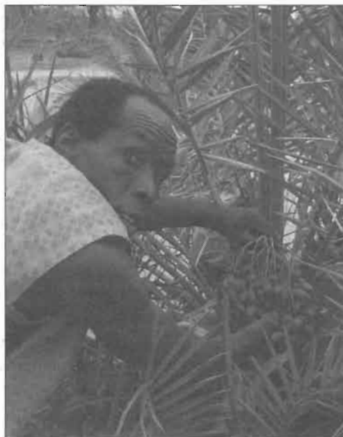
Photo 1 Récolte des dattes, à l'unité, à In Gall, juin 2002

qualités requises. Ainsi naît la palmeraie : à la qualité des hommes et de la variété répond la qualité agronomique du terroir et sa spécificité. Cette relation au lieu est fondamentale et toujours mise en avant par les phoeniculteurs : selon eux des rejets de dattiers « al medina », récemment transplantés hors d'In Gall ont dégénéré.