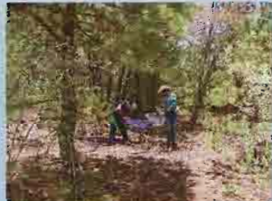
Figura 2. Aspecto de los dos predios forestales trabajados.