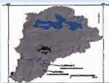
Figura 1. Ubicación de la subcuenca de Cointzio dentro de la cuenca de Cuitzeo.

El estudio se realizó en predios forestales en la cuenca de Cointzio que se encuentra al sur de la cuenca de Cuitzeo, Michoacán (fig. 1). Se escogieron dos bosques con el mismo tipo de suelo (Andosol): uno mejor conservado (BC) y uno muy perturbado (BP). En cada uno de los bosques se colocaron trampas de hojarasca (fig. 2) y se tomaron muestras de mantillo y suelo para hacer las determinaciones de los bancos y flujos de C y de las formas disponibles de algunos nutrientes del suelo.